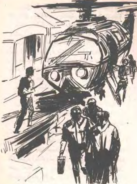
وبدا إجراءات الهبوط بالطائرة ، التي لم تلبث أن أسقرت فى مهبط

(* (ليوتولستوى) : (١٨٢٨-١٩١٠م) : كاتب وفيلسوف دبنى روس ، دغمت أعماله الأولى مكانته فى الأوساط الأدبية ، استقر بعد زواجه فى قرية (ياستنايا بوليانا) ، حيث كتب روايته (القوقاز) ١٨٦٣م ، و (الحرب والسلام) ١٨٦٥ - ١٨٦٩م ، و (أنا كارنينا) ١٨٧٥-١٨٧٧م .