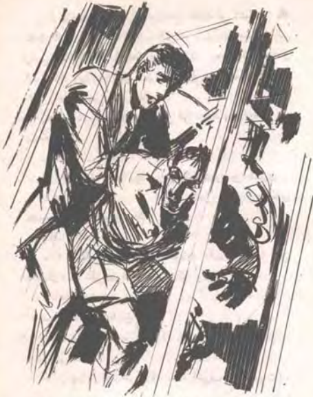
قافا وهو ينحن بسرعة البرق ، ثم يجذب (أكسيل) إليه ، ويرفع معصمه عالياً ..

مرة أخرى قاطعه (أدهم) ، قائلاً فى حسم : - (لاتسلوت) يعمل الآن لحساب منظمة جاسوسية جديدة ، تعرف باسم منظمة (سناك) ، وهو جزء من خطة تستهدف أمن (بريطانيا) كلها ، هل سمعتى جيداً ؟ قال (أكسيل) : - نعم .. سمعتك ، ولكننى لا أصدق حرفاً واحداً من الـ ..