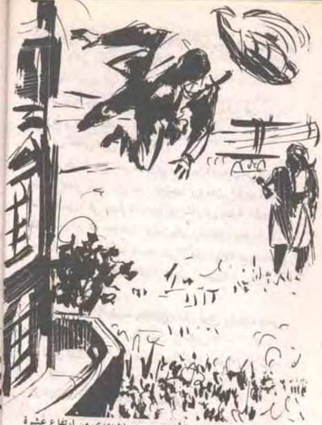
وصرخت (متى) مرة أخرى، وجسده يهوى من ارتفاع عشرة أمتار نحو الأرض العشبية ..

(٩٢ - رجل المسجل - الضربة القاسية (١٠٠))