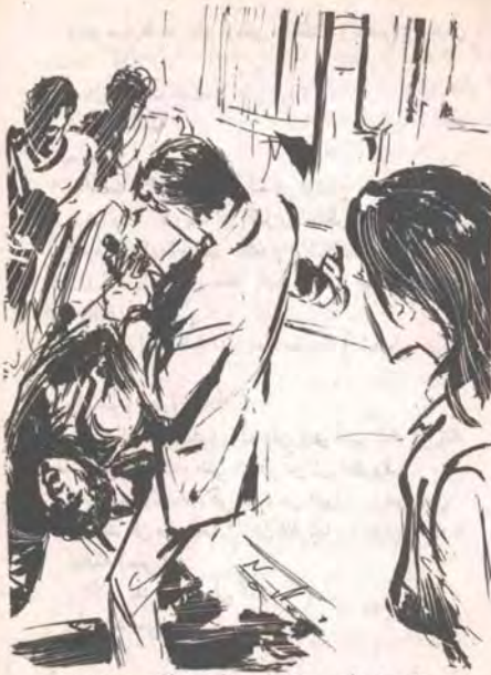
ولكن هذا الأخير استقبل ذراع الرجل بحركة سريعة ماهرة، أمسك بها معصم خصمه ..

ومع سقوط الرجل الأخير، اعتدل (أدهم)، وعذّل هندامه، قائلاً :