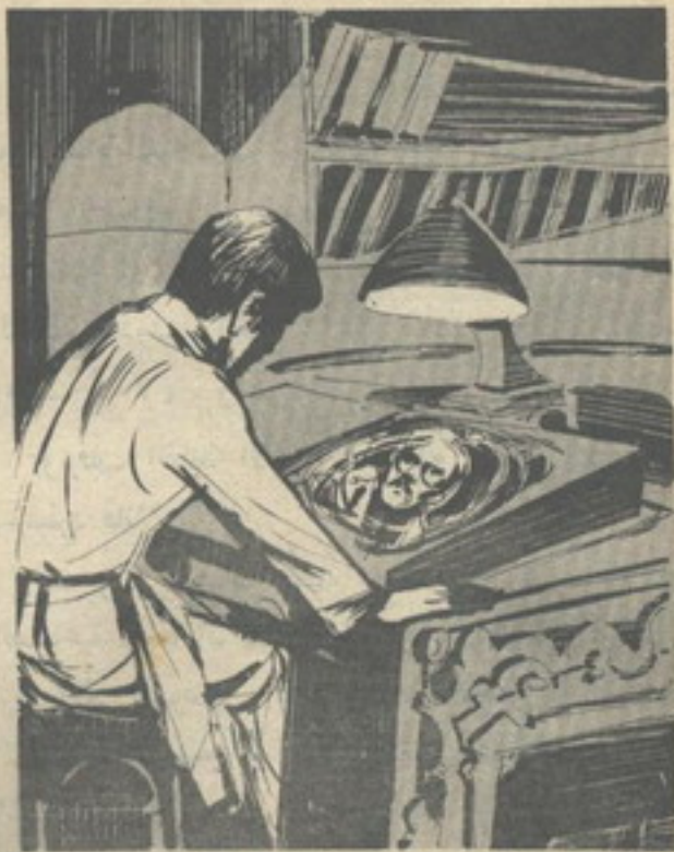
.. وظهرت داخل الأسطوانة الوهمية صورة عمسة ثلاثية الأبعاد ، تمثل القائد الأعلى للمخابرات العلمية .

تدور حول أسطوانة وهمية ، وكل منها يحمل ذبلا مضيئا ..