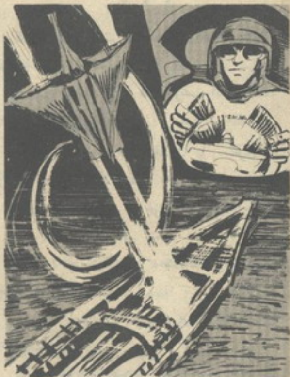
.. ودار بمقاتله الصغرة مناوذاً ، ثم انقض على السفينة المعادية في خطوط متعرجة ..

— هذا يثبت صحة استنتاجك أيها النقيب ، ولكن يجب تدميرها بسرعة ، فشدة المجال تزداد إلى درجة لن يمكن مجالنا العكسي من مواجهتها .