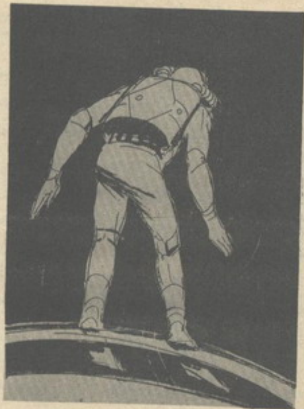
.. ثم قفز بشجاعة نحو الظلام المرعب ..

حتى عمق كيلومترين تحت الماء فنستطيع أن نقول : إن النسبة المعقولة هي واحد إلى ثلاثة تقريبا .