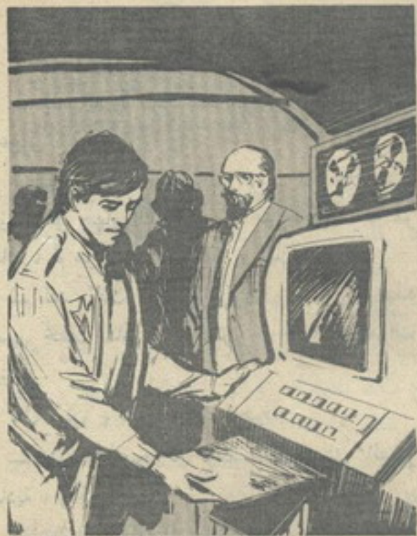
.. اسفل ( نور ) الصور التي برزت من خلال شق طولى أسفل جهاز التليفديو ..

كيف يستقر سطح معدني فوق ماء البحر دون أن تحركه الأمواج ، أو تكشفه الغواصات الحديثة ؟ .. وكيف يتسبب هذا السطح المعدني في اختفاء السفن بهذه الطريقة ؟