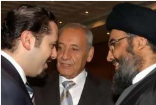
حسن نصر الله وقادة الحكومة

في مقالين سابقين قصة حزب الله 3/1، وقصة حزب الله 3/2 تحدثنا عن نشأة حزب الله ومؤسسيه، وعلاقاته الأساسية بإيران، وكذلك بسوريا، وتخطيطه لإنشاء دولة شيعية في لبنان، وانتهى بنا المقال إلى حرب 2006م حيث فشل الكيان الصهيوني في تدمير قوة حزب الله، وفشل في استهداف قادته، وترك هذا شعوراً بالفرحة العارمة عند الشارع الإسلامي، وسبب انبهاراً عند أبناء الأمة الإسلامية، خاصة وأنهم لم يشاهدوا نصراً حقيقياً على اليهود في معركة مواجهة منذ 1973م، أي أكثر من ثلاثين سنة، وتناقل الناس عبارات الثناء على حزب الله، وعلى قائده حسن نصر الله، حتى توقع البعض أن يكون حسن نصر الله هو قائد مسيرة الأمة بكاملها، متناسين في ذلك خلفيته الاثني عشرية، والتي تلزمه بالعداء الدائم لأهل السنة، أظهر ذلك أم أخفاه.