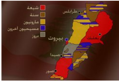
التوزيع العائدي لسكان لبنان

نشأ حزب الله في دولة لبنان، ودولة لبنان لها طابع فريد يختلف عن كل دول العالم؛ إذ إنها دولة طائفية بشكل عجيب، إذ تعيش على أرضها 18 طائفة دينية معترف بها، ولعل طبيعتها الجبلية هي التي كانت سبباً في أن يأوي إليها أصحاب المذاهب المخالفة للحكم، ومن ثم وُجد فيها النصارى على اختلاف مللهم، وكذلك الشيعة والدروز وغيرهم. ويتعارف اللبنانيون فيما بينهم على أن أكبر ثلاث طوائف في لبنان هي: طائفة المسلمين السُّنة، وطائفة الشيعة الاثني عشرية، وطائفة النصارى الموارنة، ويأتي من بعدهم بكثير الدروز، وهم محسوبون على المسلمين، وإن لم يكونوا كذلك.