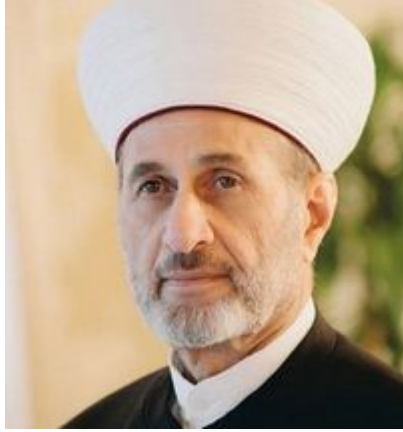
الشيخ حسن خالد مفتي لبنان

وفي سنة 1989م توفي الخميني، وخلفه في منصب مرشد الثورة علي خامنئي، ولم يتغير الوضع بالنسبة لحزب الله؛ حيث إنه ما زال تابعاً للوليّ الفقيه الجديد علي خامنئي. وفي نفس العام اجتمع أطراف الصراع اللبناني بوساطة سعودية في الطائف ليضعوا اتفاقية الطائف التي أنهت الحرب الأهلية اللبنانية، وفي نفس العام أيضاً تم اغتيال أكبر شخصية سنية في لبنان، وهو الشيخ حسن خالد -رحمه الله- مفتي لبنان من سنة 1966م؛ ليفقد المسلمون السنة زعامتهم، بينما يظهر حزب الله كرمز إسلامي في أرض لبنان.