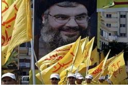
كاريزمية حسن نصر الله

إن الأوراق لا تختلط لدينا؛ فنحن نعلم خطورة حزب الله في مشروعه الشيعي في المنطقة، ولكننا ندرك في نفس الوقت خطورة المشروع الصهيوني في المنطقة ذاتها.