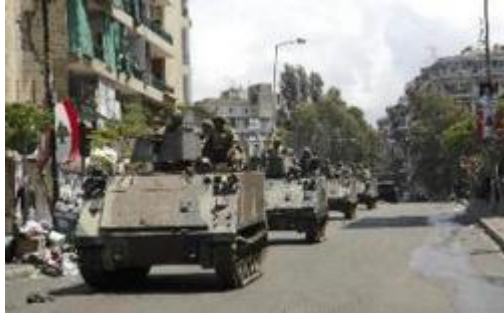
حزب الله يسيطر على بيروت

إن الأمر لم يُعد مجرد هواجس، إنها تجربة عملية على أرض الواقع لتحرك الميليشيات المسلحة للسيطرة على محاور بيروت العاصمة، بل إن هذا يلفت الأنظار إلى ما كشفه وليد جنبلاط قبل هذا الحصار بستة أيام، وتحديدًا في 3 مايو 2008م، عندما أعلن في مؤتمر صحفي أنه عثر على مراسلات بين وزير الدفاع اللبناني إلياس المر، ومخابرات الجيش اللبناني تفيد باكتشاف كاميرات تحيط بالمطار تابعة لحزب الله، وذكر أيضًا وليد جنبلاط في هذا