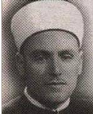
د. مصطفى السباعي

ودعوني أفترض أن الشيعة كانوا يتمركزون في شمال لبنان، وأن السنة كانوا في جنوبها، فهل تعتقدون أن الشيعة كانت ستحارب من أجل إنقاذ الجزء اللبناني التابع للسنة؟! إن هذا محالٌّ محالٌّ.. بل لعلّ التنسيق كان يتم لاقتسام الأرض اللبنانية في هدوء مع اليهود، وليس هذا الكلام بدون مشاهدات؛ فالشيعة في لبنان منذ عشرات السنين، فهل تحركوا لحرب اليهود في فلسطين؟ مع أنهم يقولون في أدبياتهم أن فلسطين بلد محتل من الصهاينة.