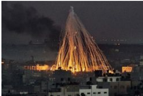
حرب لبنان 2006

ولعلّ من أكبر الأدلة على هذه الرؤية هو إقدام حزب الله في 12 يوليو سنة 2006م على القيام بعملية عسكرية ضد الصهاينة أسروا فيها جنديين وقتلوا ثمانية، دون الرجوع لا من قريب ولا من بعيد للدولة التي يشاركون في حكمها، ولا للحلفاء الذين صدعوا بها إلى المجلس النيابي، وكانت هذه العملية العسكرية هي السبب في جرّ الدولة بكاملها، وليس حزب الله فقط في الحرب مع الكيان الصهيوني.