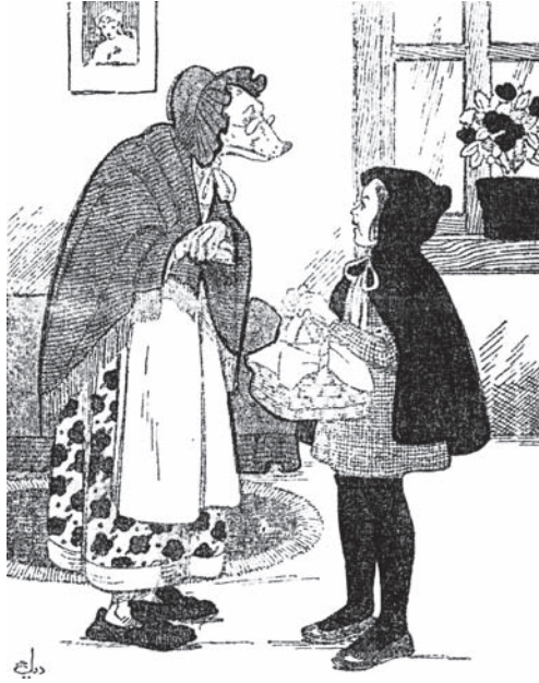
«ليلي» تُناقش الذئب.

لَا بُدَّ أَنْ أُعَاقِبَكَ عَلَى أَنَّكَ خَدَعْتَنِي، وَكَذَبْتَ عَلَيَّ.» قَالَتْ «لَيْلَى»: «أَنَا لَمْ أَخْذَعَكَ، وَلَمْ أَكْذِبْ عَلَيْكَ. أَنْتَ الَّذِي خَدَعْتَنِي: عَرَفْتَ مِنِّي عُنْوَانَ جَدَّتِي، وَهَجَمْتَ عَلَيَّ مَنْزِلَهَا. أَيَّنَ جَدَّتِي؟ اتْرُكْنِي أَبْحَثُ عَنْهَا، اتْرُكْنِي.» أَرَادَتْ «لَيْلَى» أَنْ تُفْلِتَ مِنْ قَبْضَةِ الذَّئْبِ، فَقَالَ لَهَا: «قِفِي مَكَانَكَ. إِنَّكَ لَنْ تُفْلِتِي مِنْ يَدِي.»