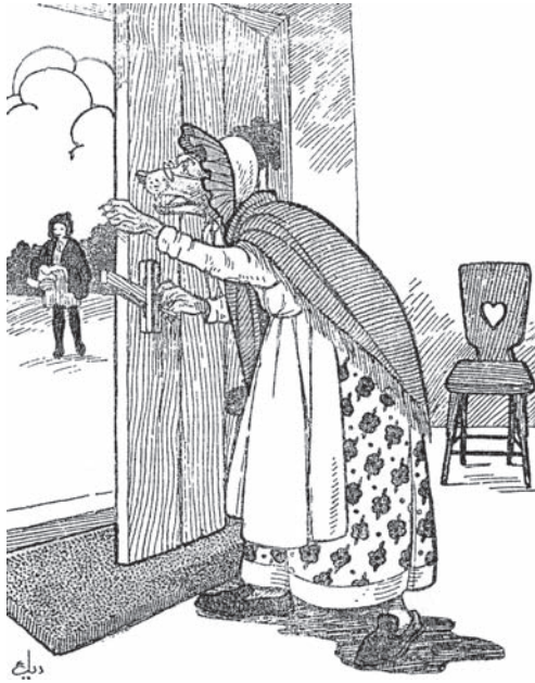
الذئبُ خَلَفَ الْبَابَ يَنْتَظِرُ «لَيْلَى».

أَرَادَ أَنْ يَنْتَظِرَ «لَيْلَى» وَأَنْ يَسْتَهْزِئَ بِهَا، وَهُوَ فِي صُورَةِ جَدَّتِهَا. نَهَبَ الذَّئْبُ إِلَى الْبَابِ، وَوَقَفَ خَلْفَهُ، يَنْتَظِرُ حُضُورَ «ذَاتِ الرِّدَاءِ الْأَحْمَرِ». لَمْ يَرَ الْجَدَّةَ، وَلَمْ يَسْمَعْ صَوْتَهَا، فَتَأَكَّدَ لَهُ أَنَّهَا نَائِمَةٌ فِي إِحْدَى حُجَرَاتِ الْمَنْزِلِ. كَانَ الذَّئْبُ، بَيْنَ حَيْنٍ وَحَيْنٍ، يَنْظُرُ مِنْ خَلْفِ الْبَابِ إِلَى الطَّرِيقِ.. فَلَمَّا لَمَحَ «لَيْلَى» — آتِيَةً عَلَى بُعْدٍ — اسْتَعَدَّ لِيَلْقَاهَا، وَيُوْهِمَهَا أَنَّ جَدَّتَهَا الْعَجُوزَ، حِينَ تَرَاهُ فِي مَلَابِسِهَا، يُقَلِّدُ صَوْتَهَا.