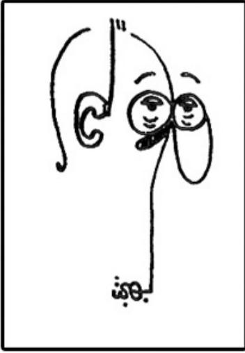
بهجت بريشته .. هكذا رسم نفسه