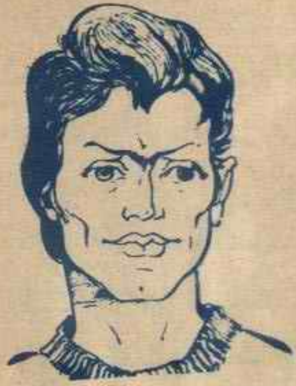
ممنوع التصوير.. في غابة الحور!

قرأ « أحمد » : هناك عصابة تبيع المعلومات . ففي الفترة الأخيرة ضجت دول كثيرة بالشكوى . فهي تعلن أن أخبارها السرية الاقتصادية والعسكرية تنتقل عن طريق جهة غير معلومة إلى دول أخرى . وتركزت الشكوى في دول تقرب حدودها من بعض . هذه الدول هي : النمسا ، تشيكوسلوفاكيا ، ألمانيا الشرقية ، ألمانيا الغربية ، بلجيكا ، فرنسا ، سويسرا ، إيطاليا ، هولندا . ورغم أن محاولات كثيرة جرت للكشف عن هذه الجهة المجهولة ، إلا أن المحاولات لم تصل إلى نتيجة . لقد عقدت هذه الدول معاهدة بحث فيما بينها ، لكشف هذه الجهة التي