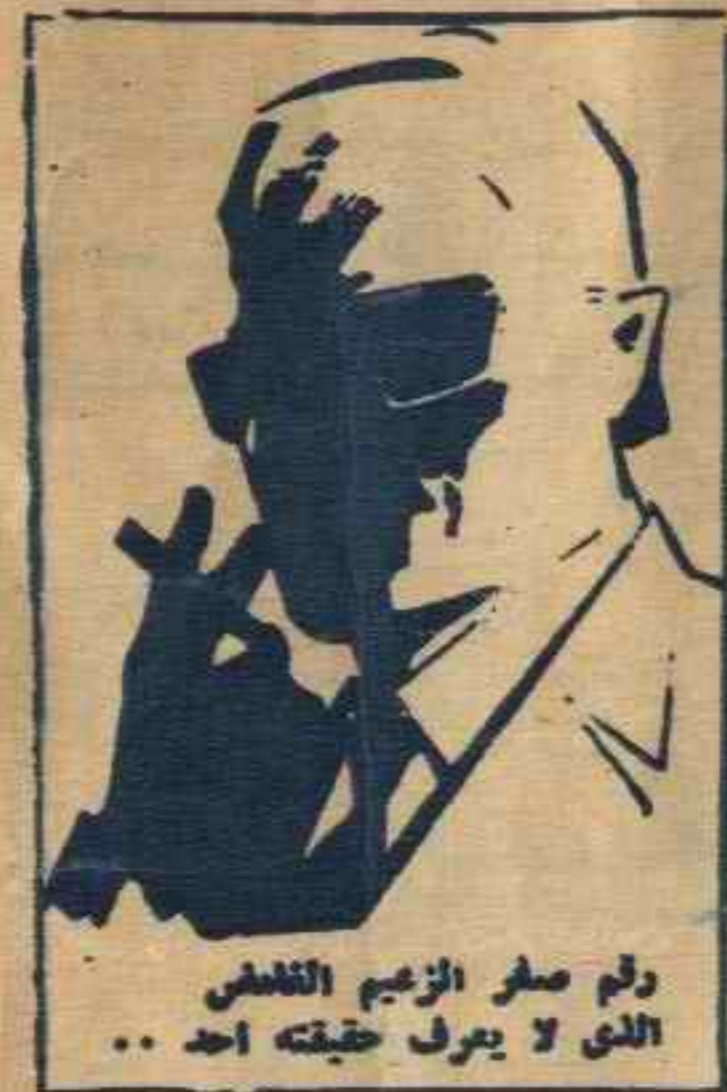
رقم صفر الزعيم الفاضل الذي لا يعرف حقيقته احد ..