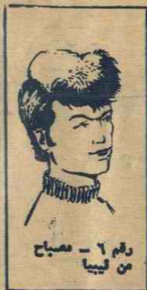
رقم ٦ - مصباح من ليبيا