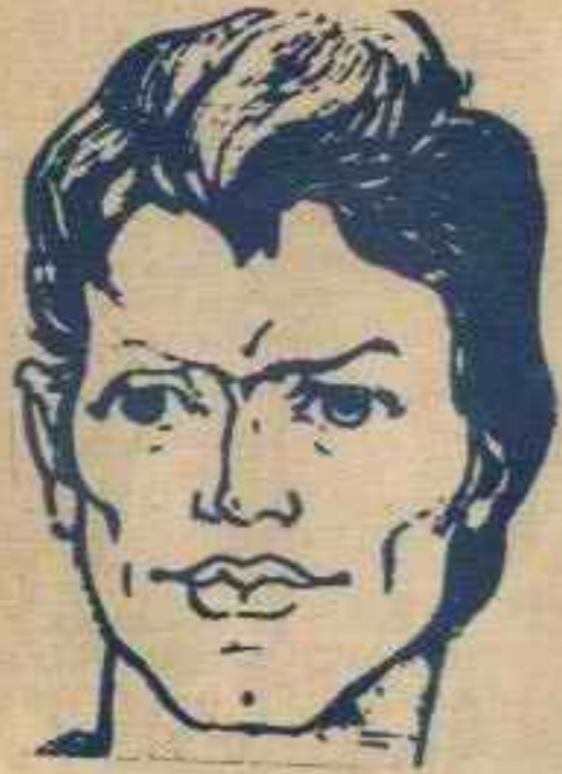
المغامرة .. تبدأ برسالة شفوية!

اتتهى « أحمد » من مغامرة « مزارع العنب » ، فودع الشياطين الذين اشتركوا معه فيها ، حيث يأخذون طريق العودة إلى « المقر السرى » . فى نفس الوقت الذى يتجه فيه « أحمد » إلى روما ، لينضم إلى فريق آخر من الشياطين ، فى مغامرة جديدة هى مغامرة « الطائفة المخطوفة » . كانت الطائفة المخطوفة ، هى تلك الطائفة التى استقلها الشياطين فى مغامرة « رجل المستقبل » ، وعندما طاردتهم العصاة فى الجو ، اضطروا إلى النزول بالمظلات ، قرب الشاطئ الفرنسى وتركوا « كابتن ن » قائد الطائفة ، ومن معه من الملاحين . غير أن رسالة وصلته