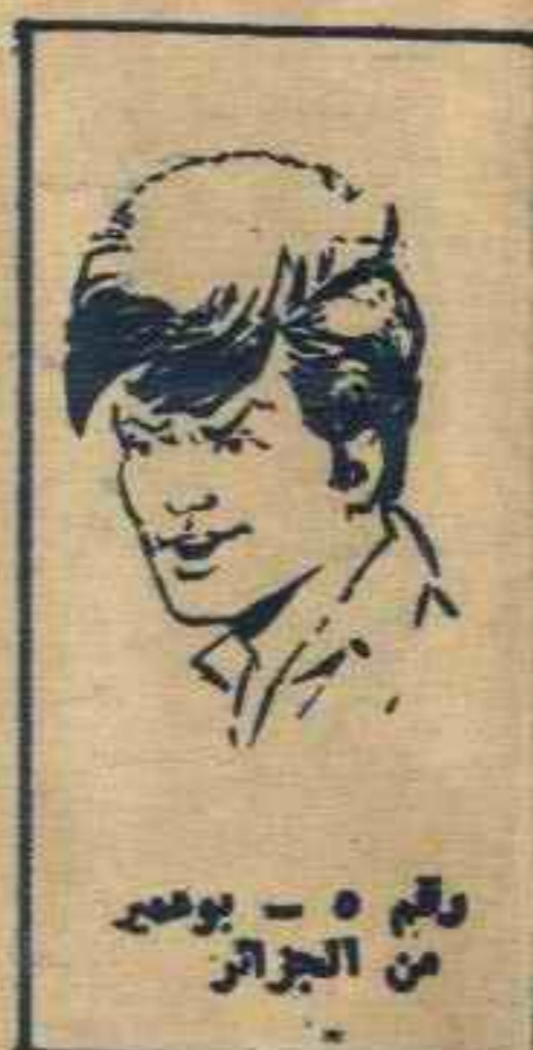
رقم ٥ - بوعصب من الجزائر