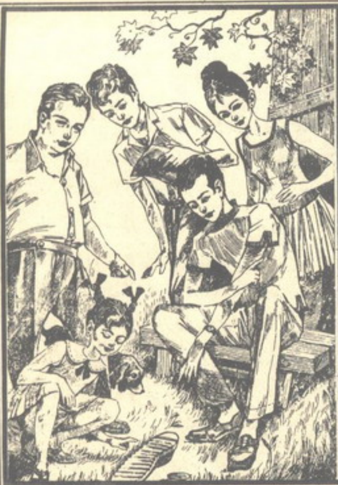
وكانت ملاحظة «لوزة» صحيحة . فلم تكن النقوش التي بنعل الحذاء مثل النقوش المرسومة