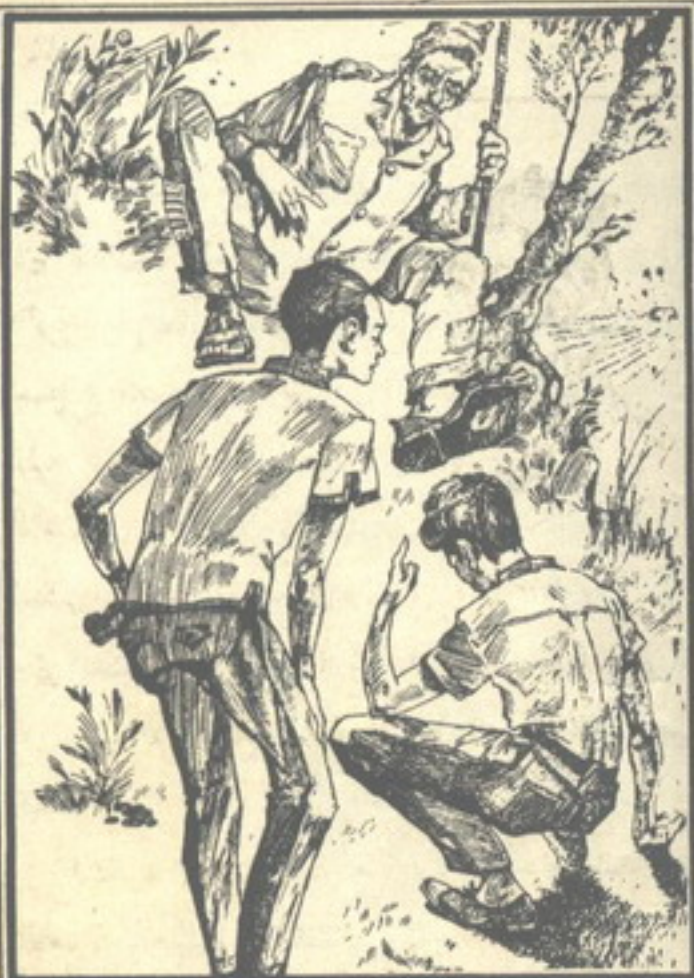
جلس «حب» على الأرض ، محاولاً رؤية نعل حذاء المشرد