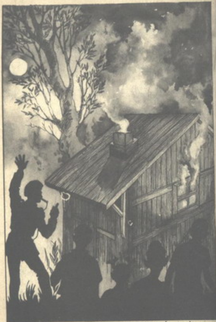
ولف الأصدقاء الأربعة يشاهدون الحريق ، بينما الشاويش «فرع» يهتدر نعليه