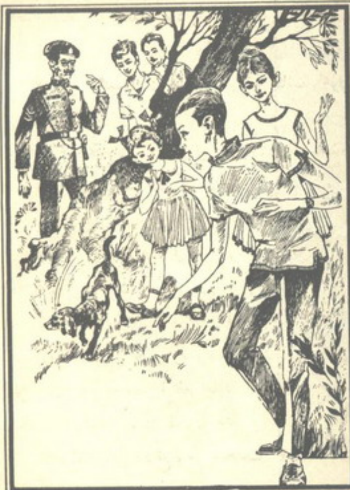
وصاح الشاويش «فرقع» فى الأصدقاء : «ماذا تفعلون هنا ؟»

كان الشاويش «فرقع» هو المتحدث ، فرد «حجب» فى ثبات : «إننا نبحث عن خمسة قروش فضية سقطت