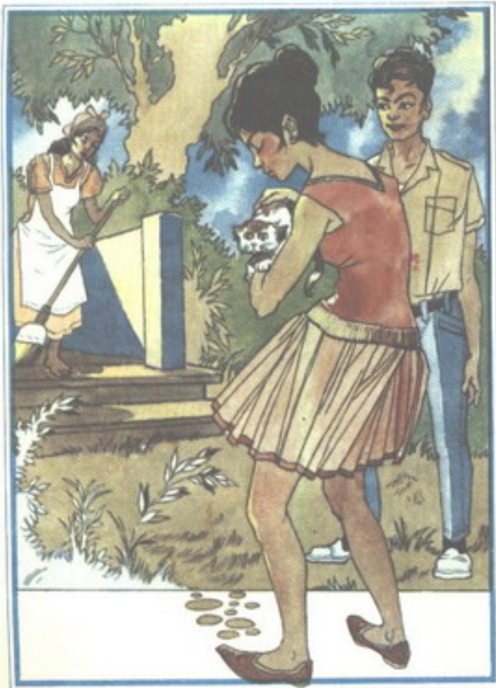
وحملت نومة - الفطه - وذهبت حيث كانت - عبوثة - نكس السلام