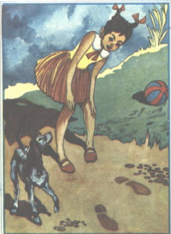
وكانت مفاجأة «للوزة» عندما وجدت النار نعل حذاء محطط كالذي شاهده الأصدقاء في مكان الحريق