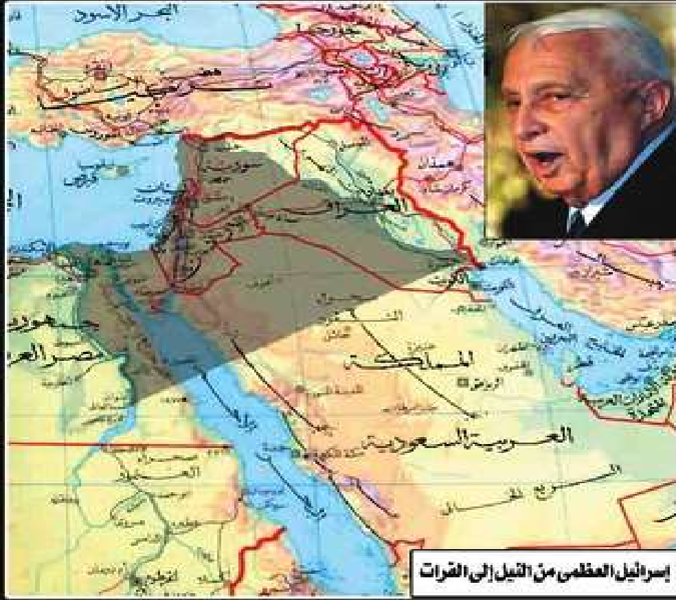
إسرائيل العظمى من التيل إلى القوات