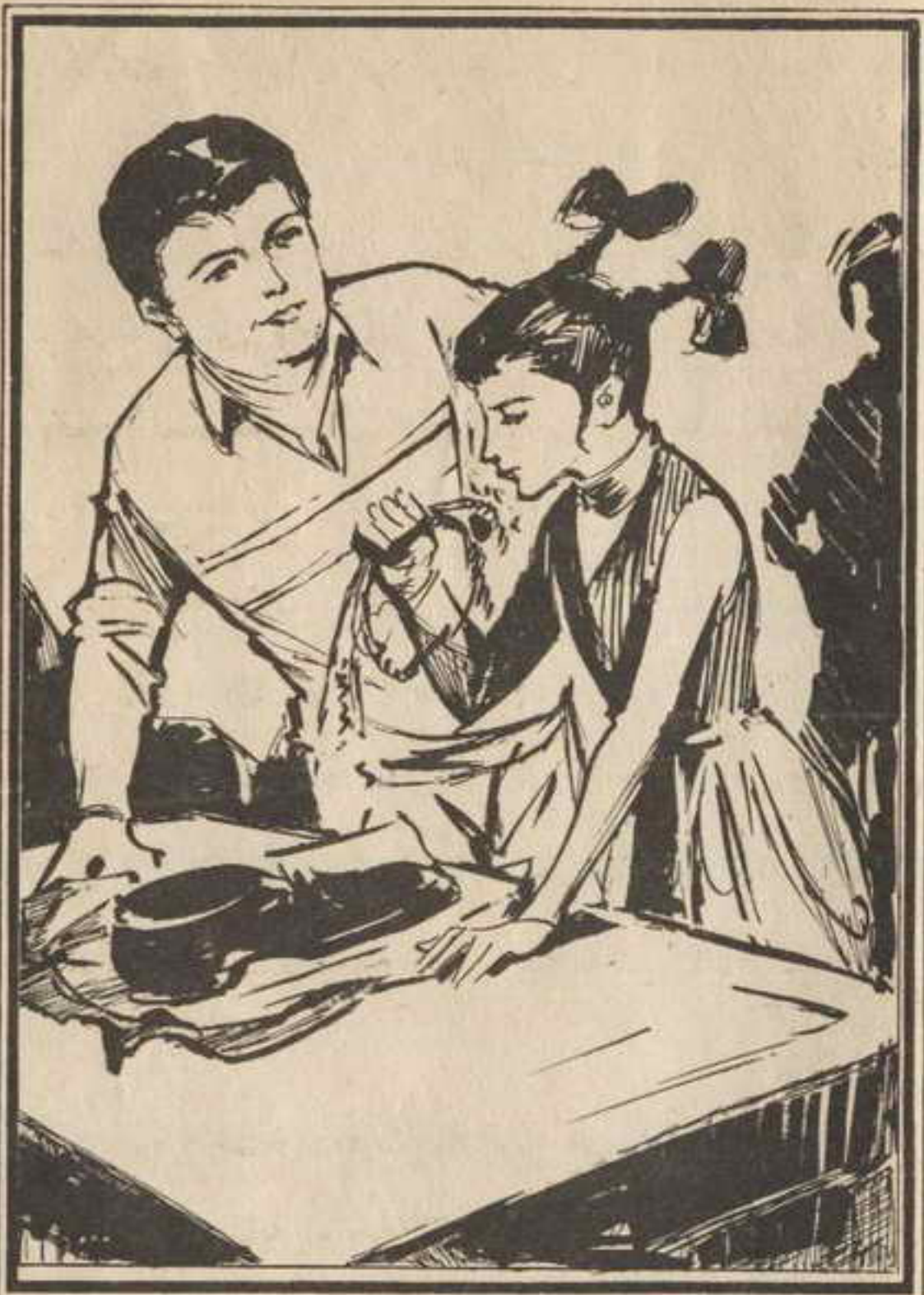
قال «تختخ»: لقد فتحت الباب لصبي الكواء، فوجدت هذه اللفة على السلام.