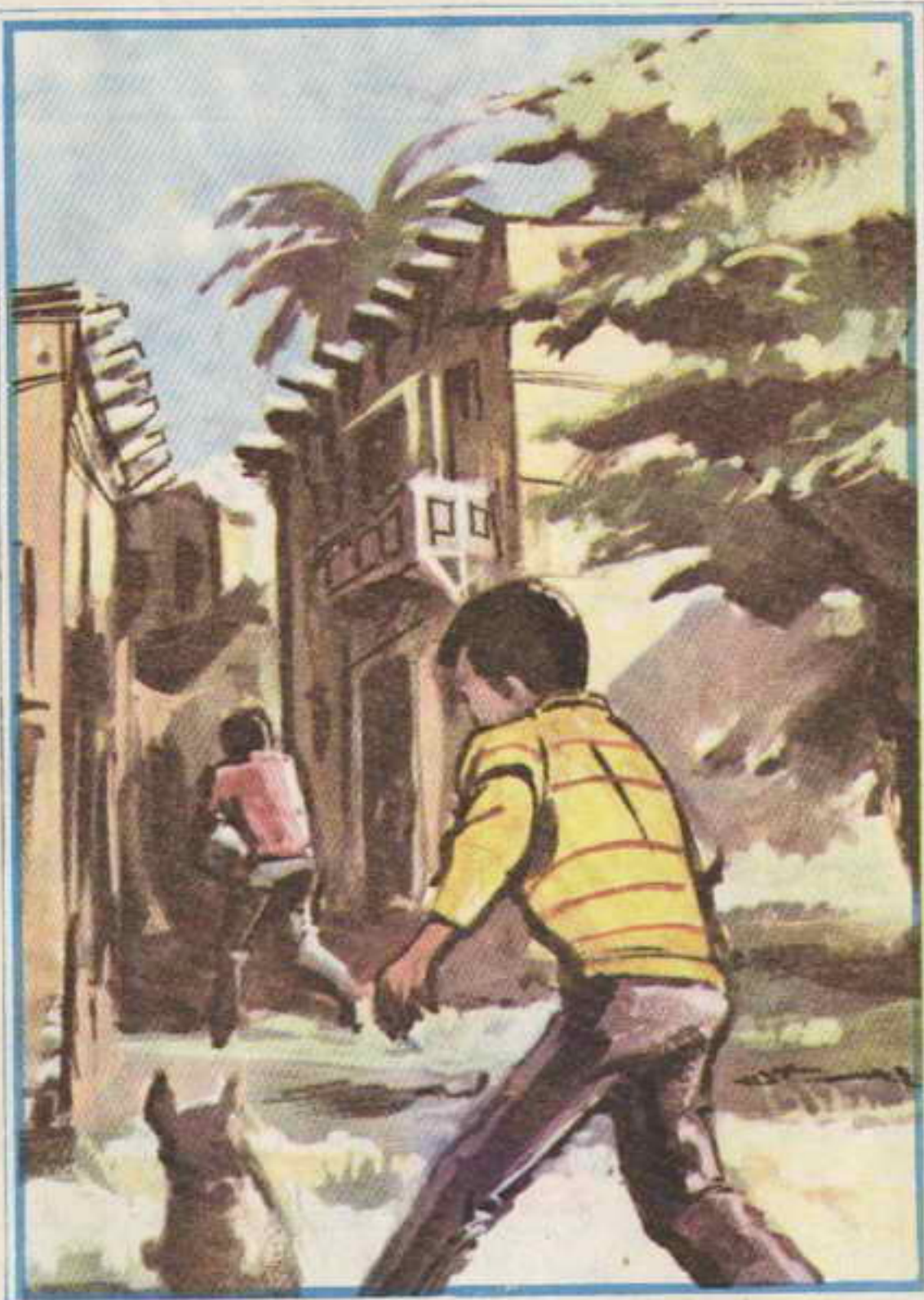
انطلق «عجب» وراء الولد الذي أخذ يجري في الخواري الفارغة