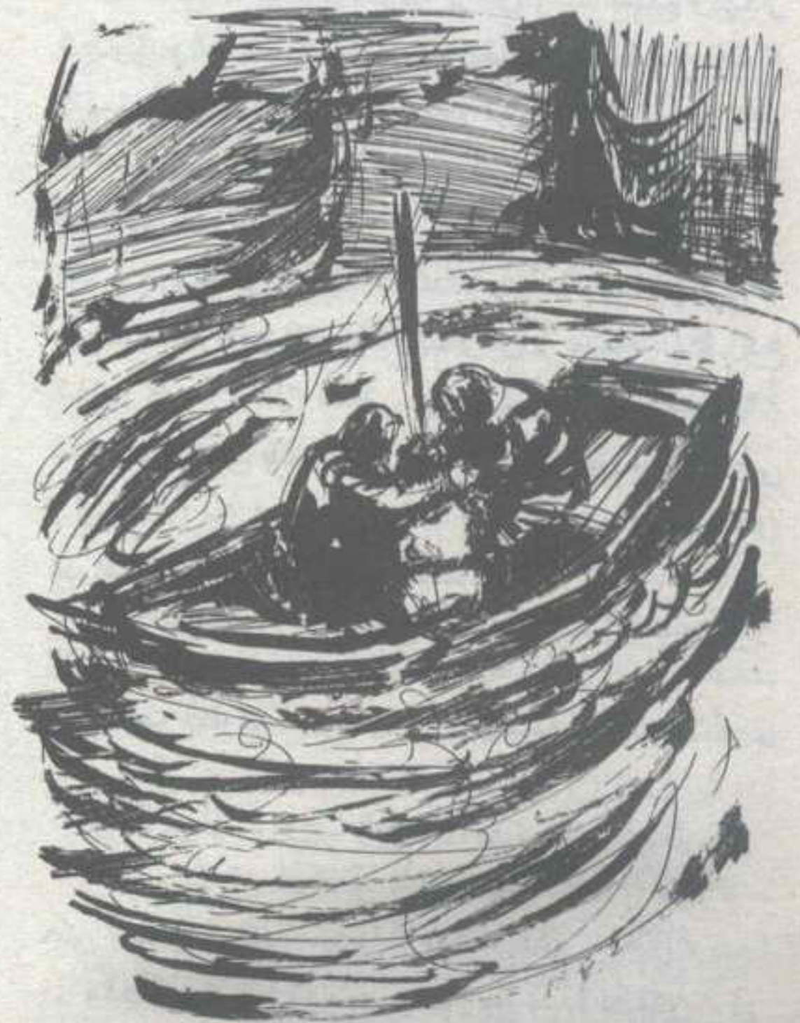
إننا نصعد .. وهذا يعنى نهاية رحلتنا إلى مركز الأرض ..