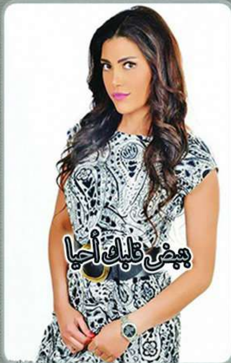
بعض قلبك أحيا