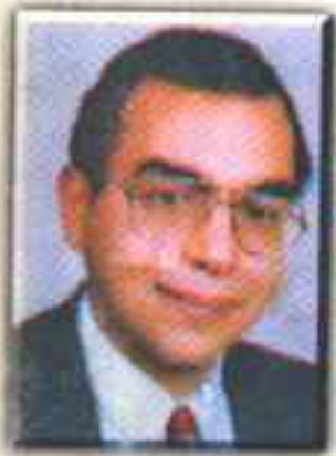
د. احمد خالد توفيق

هناك مسوخ ومسوخ .. مسوخ تزار في الغابات المظلمة .. ومسوخ تنتظر في أعماق المحيط .. ومسوخ تفتح أبواب المقابر ليلاً .. ومسوخ تفتح عيونها في ظلام معمل ما .. لكن أشنع مسخ يمكن للمرء أن يلقاه .. هو نفسه !