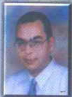
د. احمد خالد توفيق

من المفترض أن نقدم سطورا سريعة عن هذه الرواية ها هنا .. لكن هذا سيفسد كل شيء .. دعنا نتمرد على هذا التقليد ونقرأ الرواية مباشرة دون تقديم ..!