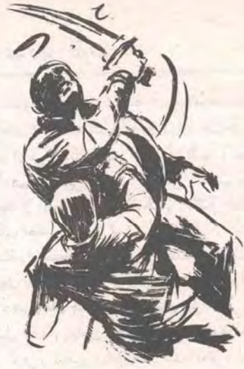
ورفع يده المسكة بالسيّف ، ليهوى به مسرة أخسرى على رأس ( أدهم ) ..

حول عنق العملاق ، ورفعها ليهوى بها — مستخدماً كل قواه — على مؤخرة عنق ( بنيامين ) ، الذي تأوّه في خوار متصل ، ولكنه لم يسقط أرضاً ، ولم يفلت السيّف من يده ، وإنما أصابه الجنون ، فأخذ يدور حول نفسه ، ويدير ذراعه حول جسده ، محاولاً اقتصاص خصمه .. وتحرك ( أدهم ) في مرونة وهو يحاور ذراعاً ( بنيامين ) ، وهنا قبض العملاق على مقبض السيّف يكلنا قبضته في قوة ، ثم دفع ذراعه إلى أعلى ، وإلى الخلف ، وهو يهوى غرس السيّف في ظهر ( أدهم ) ، ولكن بطلنا أفلتت ذراعاه ، وقفز مبتعداً في اللحظة ذاتها ، ولم يتوقّف اندفاع النصل البرّاق المتعطش للدماء ، وإنما انغرز في ظهر صاحبه .. أصاب العملاق نفسه في غمرة الغضب والثبور ، وأطلق خوارجاً متألماً ذاهلاً ، وعجزت ذراعاه عن انتزاع السيّف من جسده ، واحتقنت عيناه بالدماء ، وجحظنا وهو يتطلّع إلى رئيسه في ضراعة ، ولكن