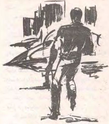
ثم تحرك في حفة القط ومرونة الفهد نحو مهبط الطائرات ، كانت خطته تعتمد على سرعة واحدة من الطائرات ..

ثم تحرك في خطوات أقرب إلى السوئب ، نحو ( القانتوم ) الرابضة على المهبط ، وقبل أن يصل إليها