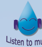
Listen to music