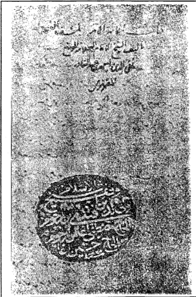
الصفحة الأولى - صفحة العنوان - نسخة مكتبة ولي الدين بجامع بايزيد - باستامبول (٣١٩٥)