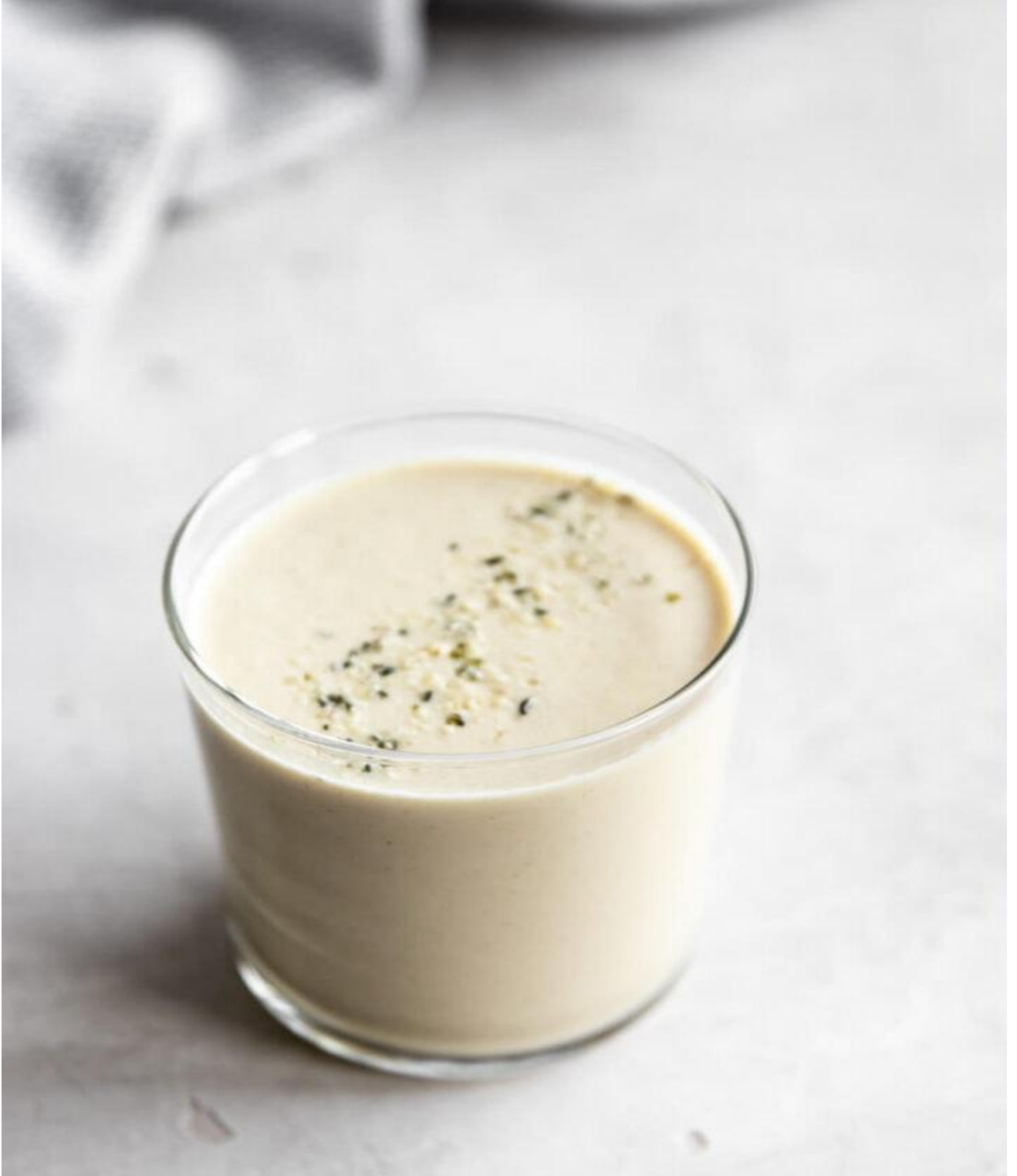
عصير الأناناس وجوز الهند