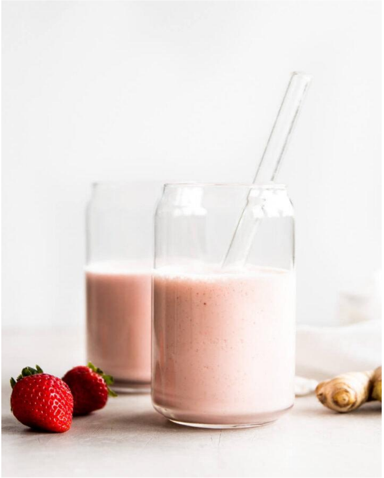
عصير الفراولة والزنجبيل