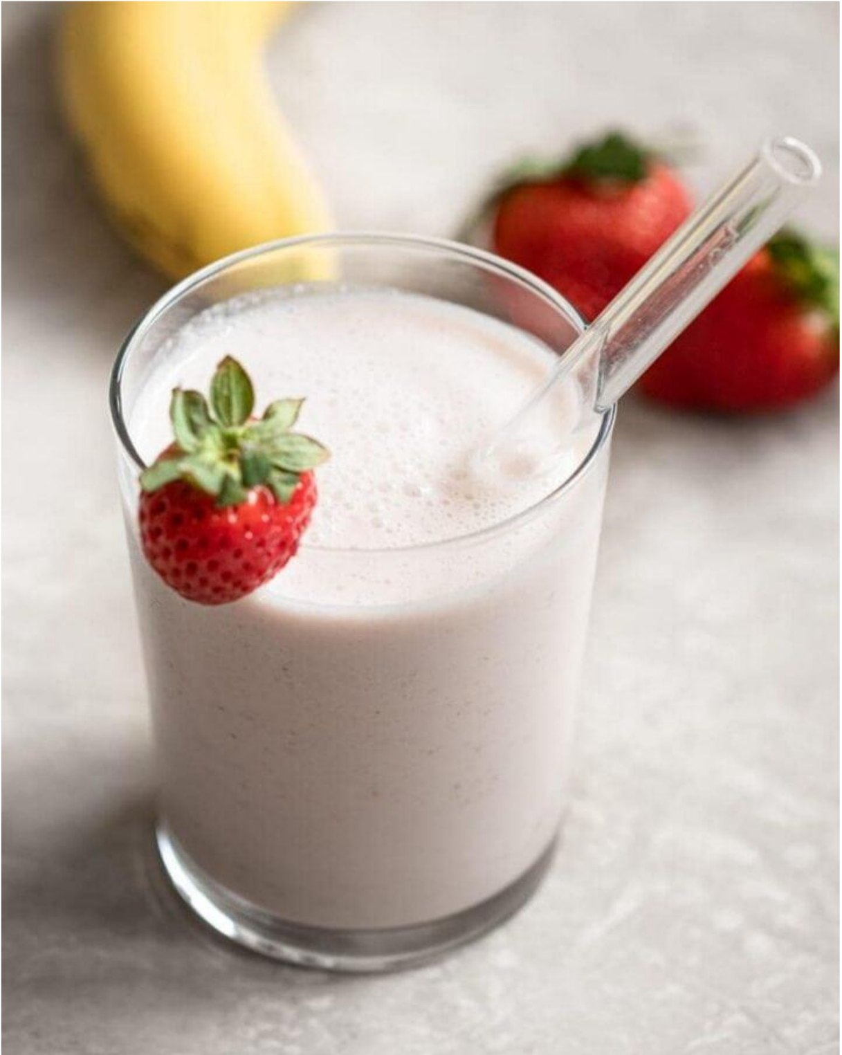
سموٲي الموز والفراولة