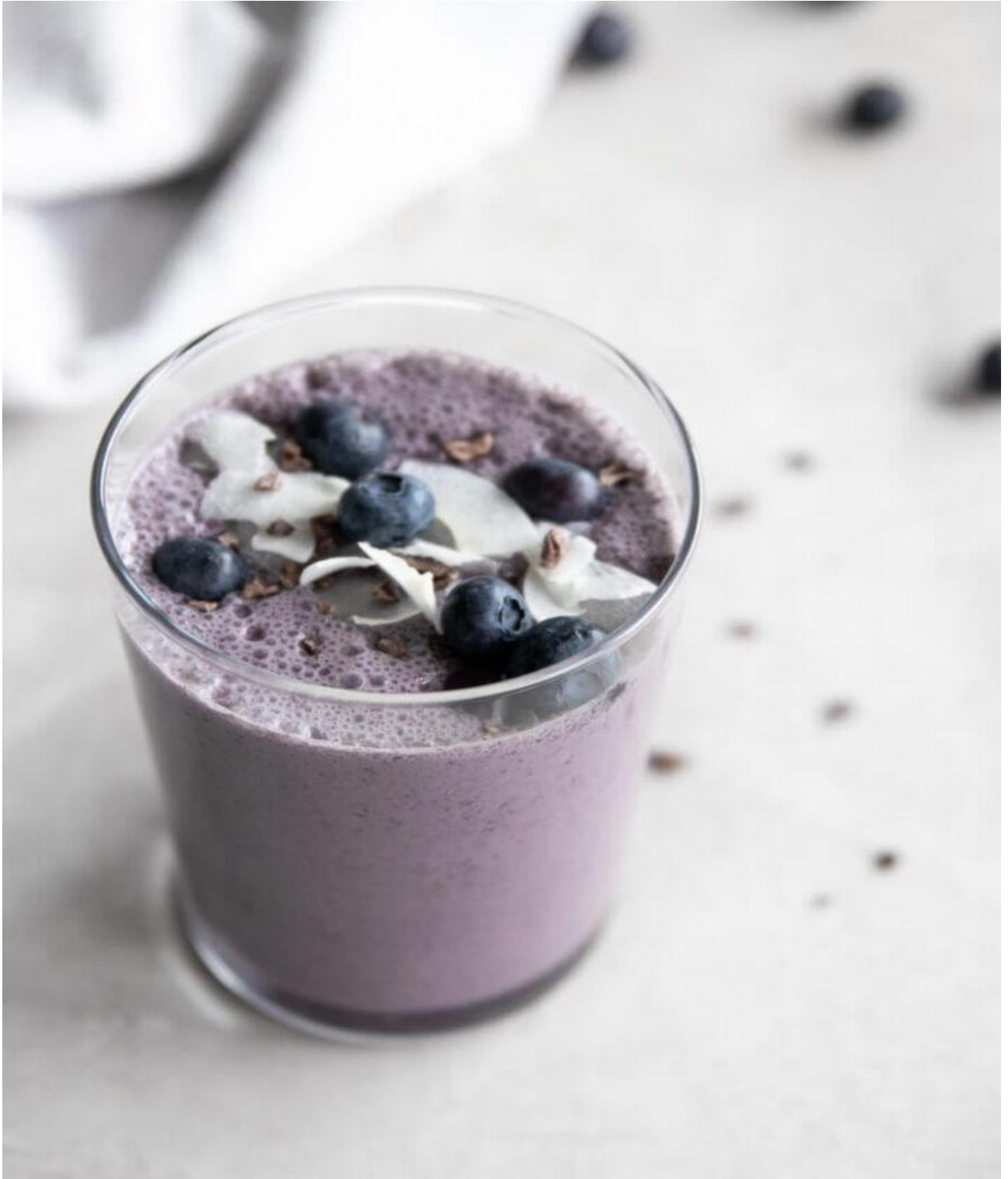
عصير التوت الأزرق