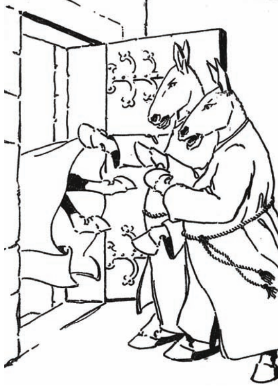
فرماه البغال خارجًا وأغلقوا الباب.

ألتأييد سلطتنا التي هي واحدة؟ ألينتصر بعضنا على بعض بقتل أنفسنا؟ فما هو يا ترى سبب شقاقنا؟ ما الذي فرّق بيننا، وجعلنا أعداء الداء؟ إني أحجل حينما أتأمل بهذا السبب الطفيف الذي نجمت عنه هذه الانشقاكات القتالة، أليس سبب انشقاقتنا نحن الخيل عن الجمعية الأصلية قضية أحد الحمير الكبار الذي أراد أن يقترن بدابة في الدير، ومنعه عن ذلك نائب الأسد، فقامت قيامة الحمار الفصيح على النائب العظيم.