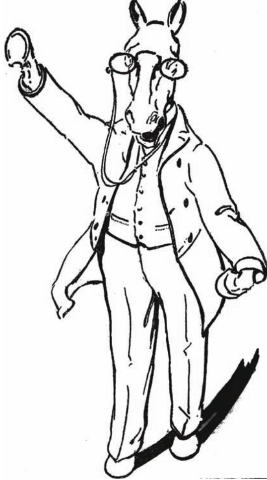
الحصان يخطب: نحن ضد التمدن الحديث.

فصرخ الجميع بصوت واحد «الاتحاد والحياة»، «الاتحاد والمحبة»، وأخذوا يلبطون بأرجلهم دلالة الاستحسان والإعجاب بما جاء به ذلك البحر الفهامة من بلاغة المعاني، وفصاحة الكلام، وسداد البرهان، وقوة الحجة، ثم قام البغل وشكر أولاً صاحب الدعوة،