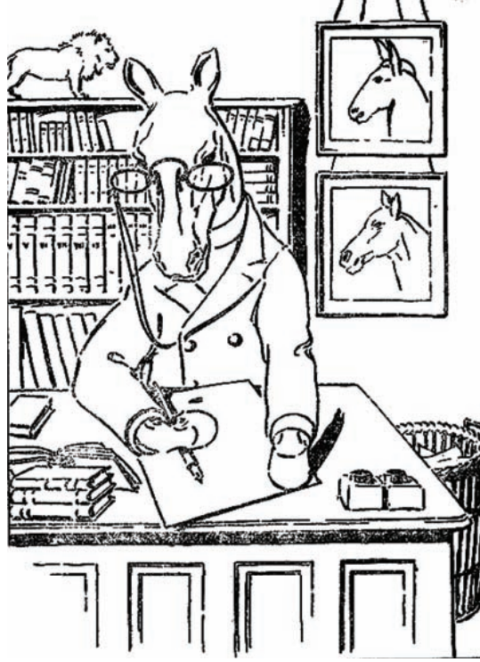
الحصان في مكتبه.

على جانب عظيم من القوة والمكانة، فيالسرور، أي حظ وأي انتصار مبین، لا بد من أن أقول بعد هذه المأدبة قول الشاعر: