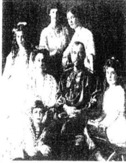
صورة نادرة لآل رومانوف جميعاً

وبدأت رحلة تصفية الأسرة الحاكمة بعد نجاح الثورة.. وأصبح نيقولا الثاني.. آخر الحكام القيصرية.. وتعرضت سلالة آل روما نوف لعملية اغتيال جماعي إبادتها عن آخرها.. فقد كانت نهاية راسبوتين علامة على بداية النهاية للقيصر نيقولا وزوجته الإمبراطورة ألكساندرا وكذلك حكم آل روما نوف بالكامل.. فبعد عشرة شهور من وفاة راسبوتين.. أطاحت الثورة الروسية التي اندلعت في أكتوبر عام ١٩١٧ بأخر جيل من سلالة رومانوف.. بعد أن تنحي نيقولا الثاني عن الحكم لولي عهده أولاً.. ثم قام بتغيير القرار لصالح شقيقه.. وبعد مرور تسعة عشر شهراً على مقتله.. أعدم القيصر وعائلته بأيدي الثوار البلشفيين في إيكاترينبرج..