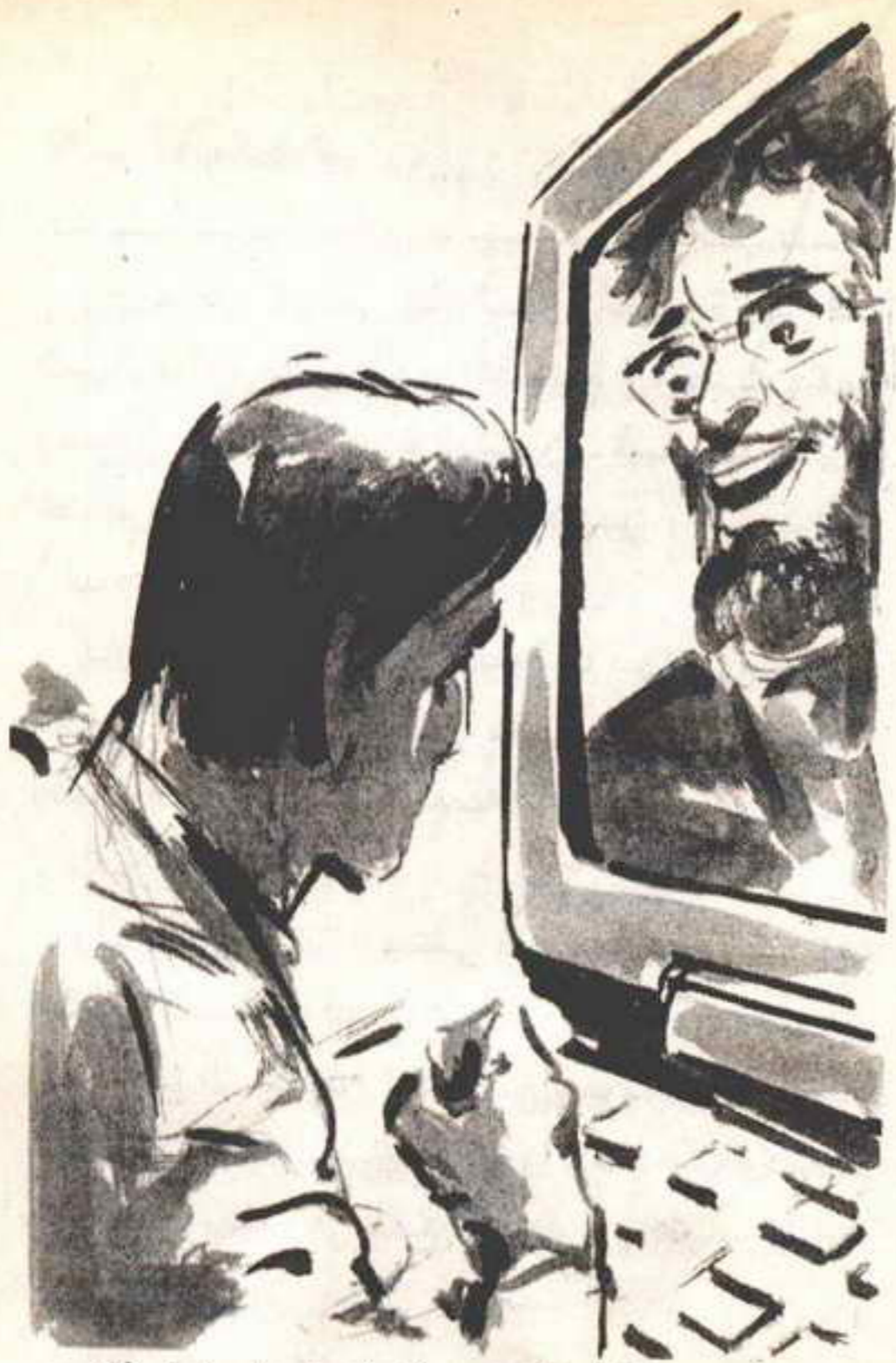
بدا الغضب لحظة على وجه (نور) ، ثم لم يلبث الغضب أن تحول إلى اهتمام بالغ ..

الغضب أن تحول إلى اهتمام بالغ ، وهو يغمغم في حيرة : - عجباً !.. لماذا يبدو وكأنه ... قاطعته ( سلوى ) في انفعال ، قبل أن يتم عبارته : - ( نور ) . التفت إليها في حركة حادة ، قائلاً : - هل حددت موضع الاتصال بهذه السرعة ؟! بدا عليها توتر بالغ ، وهي تجيب : - إنه يتحدث من هاتف عام يا ( نور ) . ثم أشارت بيدها ، مستطردة : - الهاتف المقابل للمبنى مباشرة . اتسعت عيناه في شدة ، وهتف ( رمزي ) ، وهو يثب من مقعده : - مستحيل !! وبحركة مدهشة ، قفز ( نور ) من مكانه ، وأزاح ستارة النافذة ، وتطلع عبرها ، و ... واتسعت عيناه عن آخرهما .. فأمام المبنى مباشرة ، وإلى جوار هاتف الفيديو ، كان يقف خصمهم مبتسماً في سخرية .. خصمهم الدكتور ( هاشم صدقي ) .. شخصياً .