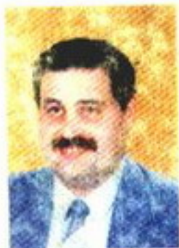
د. نبيل فاروق