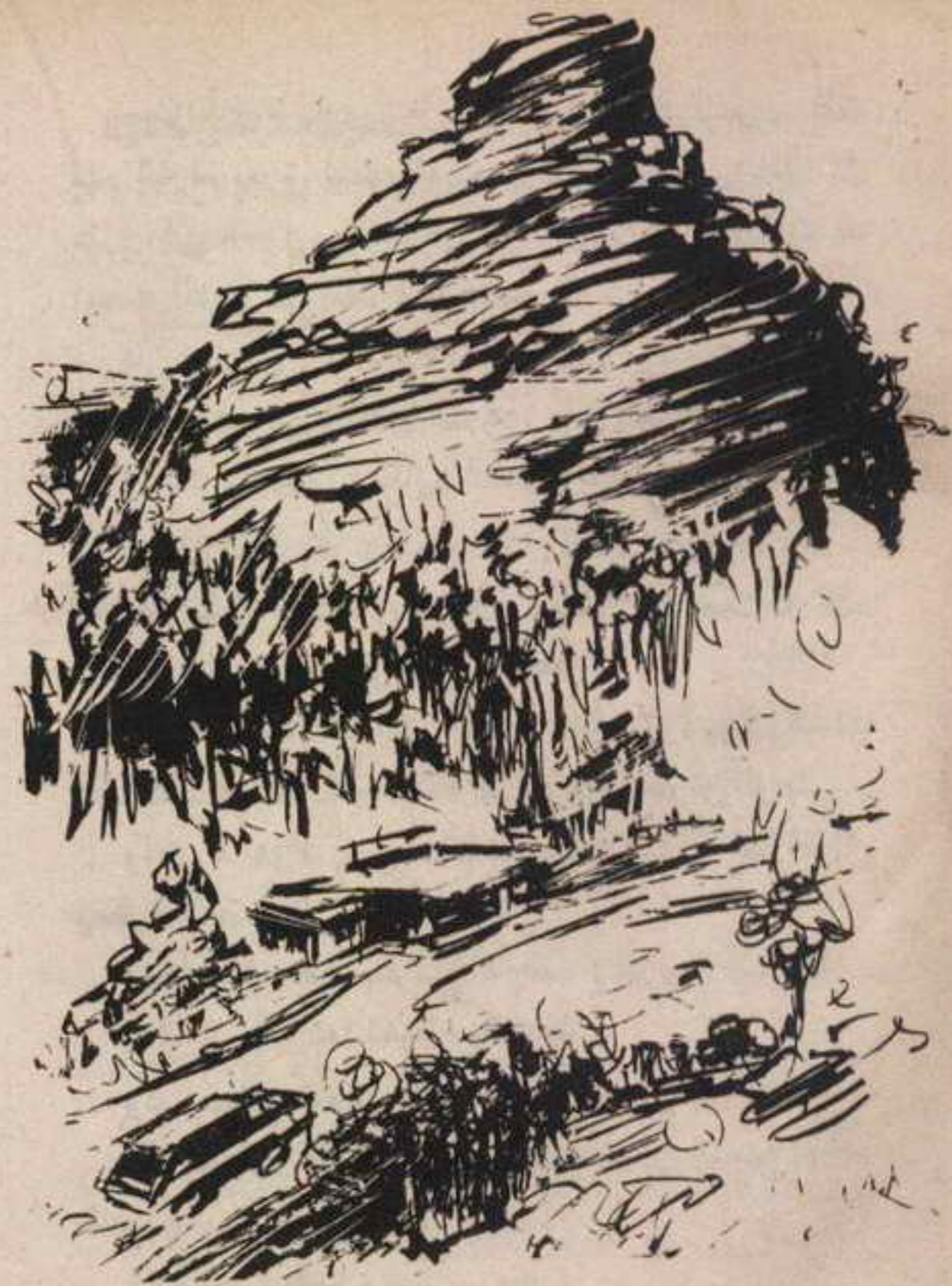
كان البرج يقف وحيداً .. متفرداً ..

القشعريرة تزحف عبر كتفى ( نيرى ) حين أدرك أنه صنع نموذجاً متقناً لهذا الشيء دون أن يراه .. سعل لينظف حلقه .. ثم غمغم : - أعتقد أننا يجب أن نتحرك وإلا رأونا .. ووجدنا محطة بنزين منسية عن قرب ، فذهب ( نيرى ) إليها وحاول تشغيل الطلمبة .. ثم دس الخرطوم فى خزان وقود سيارته .. لم تزل هناك كهرباء لحسن الحظ .. وأخيراً امتلأ الخزان .. وهنا سمعنا صوت ( الهليكوبتر ) .. جذبها من ذراعها ودخلا إلى كابينة المحطة أملين أن تمر الطائرة دون أن تلاحظ شيئاً .. كانت مجموعة من طائرات الهليكوبتر الخاصة بالقوات الجوية تدنو منهما .. وثمة طائرة ( شيبين ) انفصلت عن الحشد .. ثم هبطت بسرعة حتى كادت تلامس سقف الكابينة ، وشاهدا رجلاً يطل من الهليكوبتر مرتدياً منظاراً أسود وفى يده كاميرا فورية يصوبها ..... نحوهما .. أطلق ( روى ) سبة .. ومدّ يده إلى جيبه مخرجاً ورقة بعشرة دولارات ..