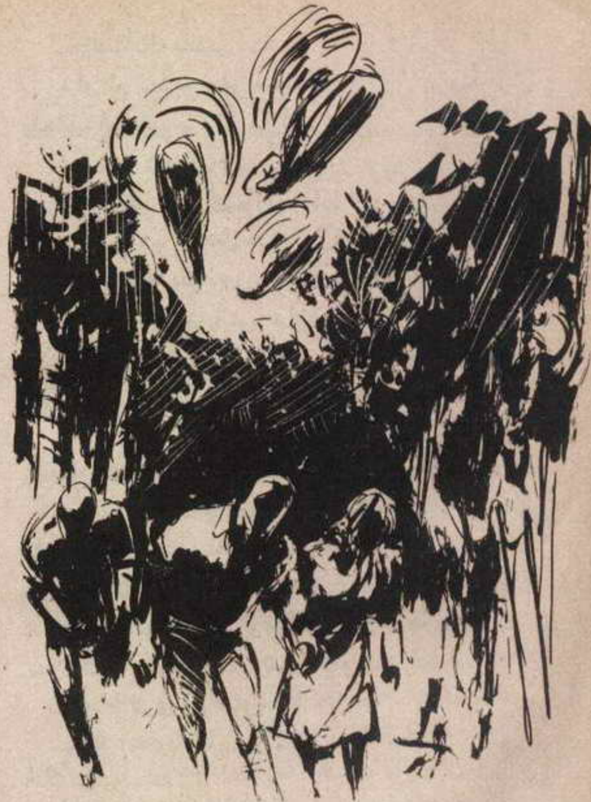
كان المهربون الثلاثة يعبرون أشجار الشربين عند قاعدة برج

كان عدد من سلاح المهندسين يقومون بنقل سعة عشرة جالونات من الصفائح الحاوية للمادة ( إي - زد - ٤ ) إلى طائرات الهليكوبتر بينما المراوح تزار منذرة بالويل .. كان الميجور ( وايلد بل ) يعرف أن كتيبة القوات الخاصة قد انتشرت في الجبل ، وبدأت الصعود قائمة بالتمشيط مستعملة الأشعة تحت الحمراء ..