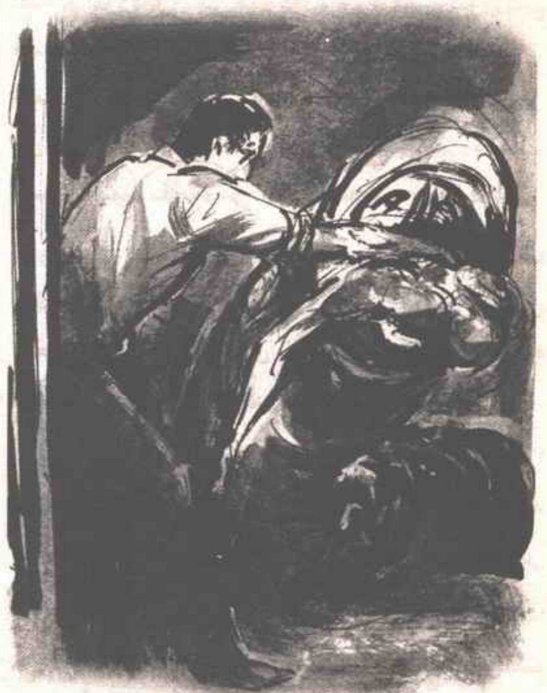
وبسرعة حشرت القفاز حشراً حول الطرف الظاهر من قصبته الهوائية تحت عنق الرجل ..

ثم ركلتنى فى ساقى حتى كادت تحطم قصبته ، لكنى جررتها من معصمها جراً نحو الباب ، وصحت فى ( براكستون ) :