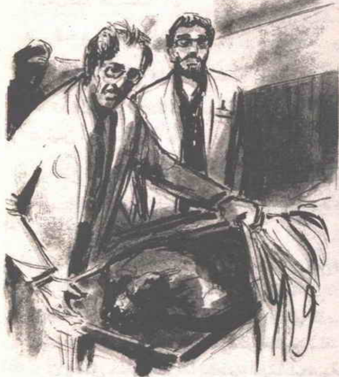
ووجدنا نفسينا - أنا والروسي - نقف الآن أمام جثة زنجية ملوثة بالعرق ..

وبعد جهد عنيف ، وجد الموت أنه استمتع بوقته بما يكفى ، وأن عليه الآن أن ينتهي بسرعة .. ووجدنا نفسينا - أنا والروسي - نقف الآن أمام جثة زنجية ملوثة بالعرق .. لقد انتهى السر الكوني الذي كان يجعلها تتحرك وتتأوه منذ ثوان .. وهز رجل الإسعاف الإفريقي رأسه في أسى ، وكف عن التخمين لحظة على سبيل الحداد ، ثم قال :