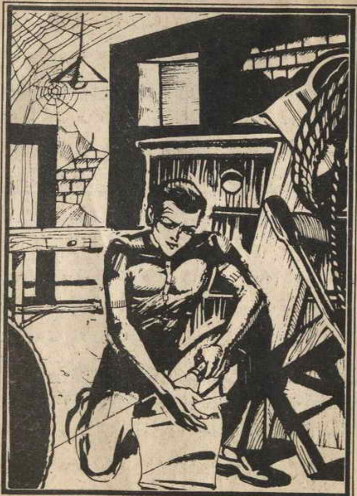
وجد محب شيئاً أخذه معه .. وخيل إليه أنها خريطة

وسار « محب » على أطراف أصابعه حتى باب الغرفة وفتحه .. ووجد صالة مظلمة .. وأخذ ينصت .. وخيل إليه أنه يسمع نفساً يتردد ، نفساً خافتاً ضعيفاً .. لشخص نائم ..