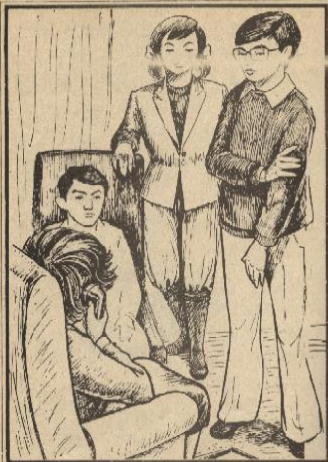
هبت « فلفل » من مجالسها وتوجهت إلى التليفون

ردت « مشيرة » لا يا عزيزتى .. لا تحكى على الأمور بسرعة . ربما حدث شيء ما عطلها في الطريق . قال « طارق » محاولاً أن يطمئن « فلفل » : ربما أخذت سيارة أجرة فتعطلت بها في الطريق . قال « خالد » : وربما ذهبت لزيارة أحد في طريقها . قالت « فلفل » : زيارة من يا خالد ؟ إنها مرهقة من السفر .. إلى جانب أنها تحمل حقيبة ملابس ثقيلة . قالت « مشيرة » : على كل حال الساعة الآن التاسعة والنصف ، لم يمض كثير من الوقت حتى نقلق .. اطمئنى يا « فلفل » ربما تصل في أى لحظة ، فعلينا أن