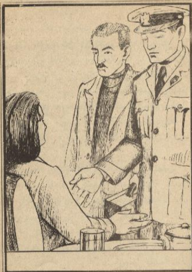
توجهت قوة الشرطة إلى المائدة التي عليها السيدة

قال « طارق » : على كل حال ، لم يعد هناك شك أن الحالة « علية » عندما تأخرنا عليها بسبب صديقك