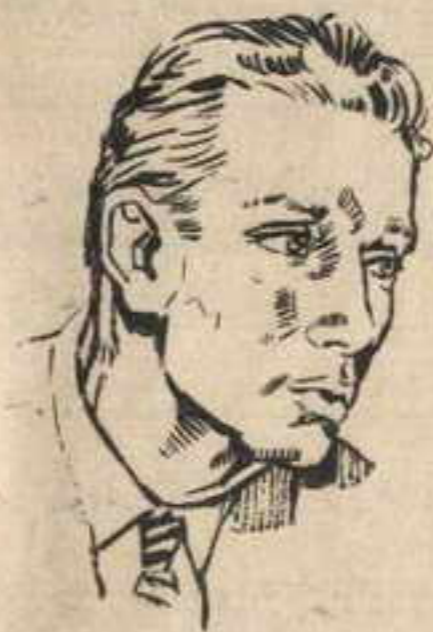
الهر « فوجل »

أصبح المغامرون في حيرة شديدة أمام ما يدور حولهم من أحداث . إنهم لا يجدون لها تفسيراً مقبولاً ، طالما أن « ممدوح » يخفى عنهم الحقيقة ! . لماذا كل هذا التكتّم ؟ لا جدال في أنه مشترك في عملية على أعلى