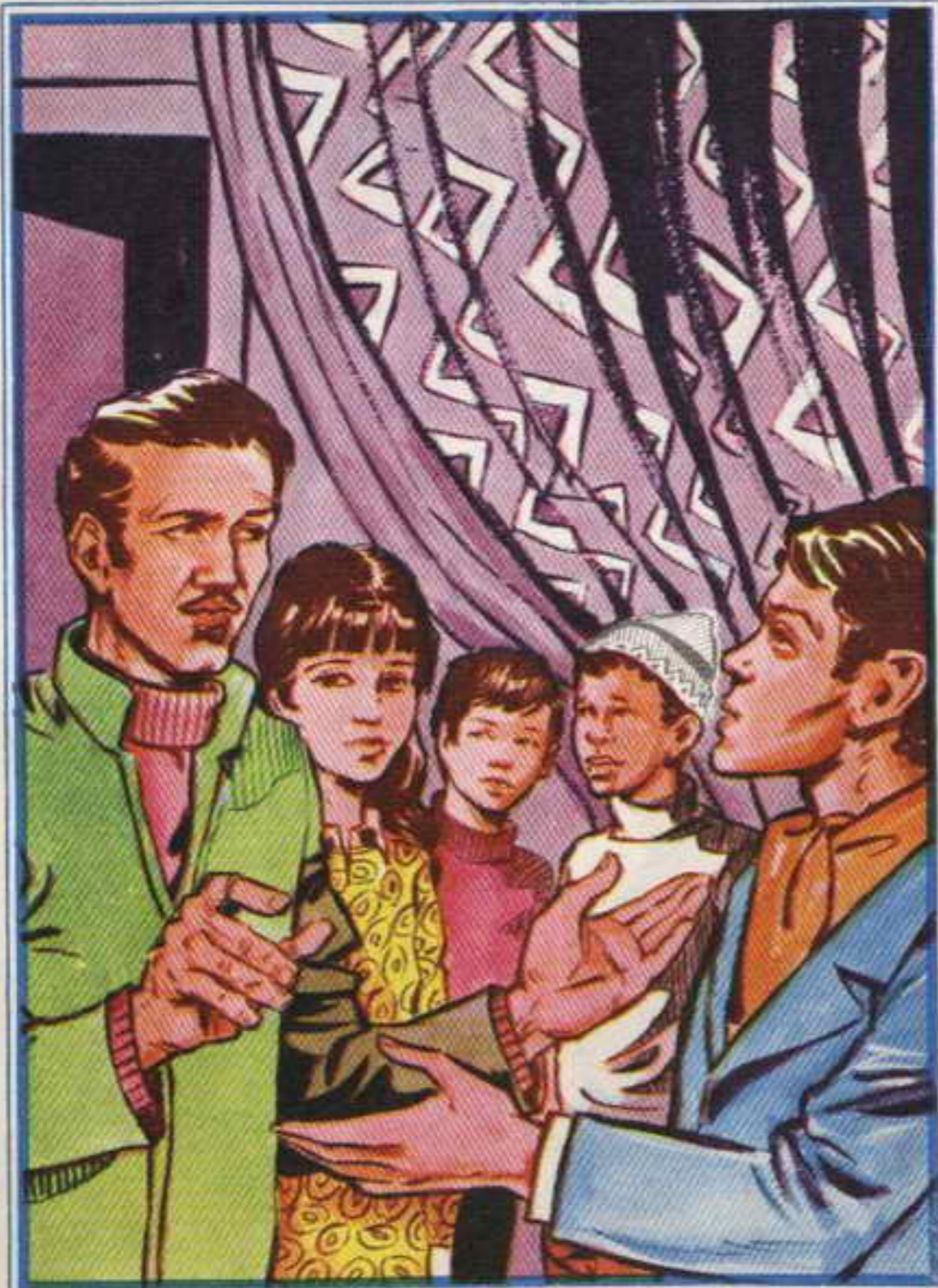
قال «عارف» : ولكن المفاجأة التي تخفيها عنا ؟

سمارة : على أن نركب «الجندول» في العودة ! .. كان المغامرون يشعرون بالسعادة الفائقة ، وقد نسوا ما هم فيه من إرهاق وإجهاد ، وهم يعبرون الكبارى الحجرية الأثرية المقامة فوق القنوات ، واحداً بعد آخر . ويحتازون الشوارع الملتوية والأزقة ، وبعضها لا يزيد عرضه عن متر واحد ، وكلها تفيض بالسائحين الوافدين إليها من أنحاء المعمورة . لقد بهرهم منظر «الجندول» وهو ينساب فوق صفحة الماء ، على ضوء الأنوار والثريات المتلألئة ، وصوت غناء النوتى ذى اللباس التقليدى يتردد في