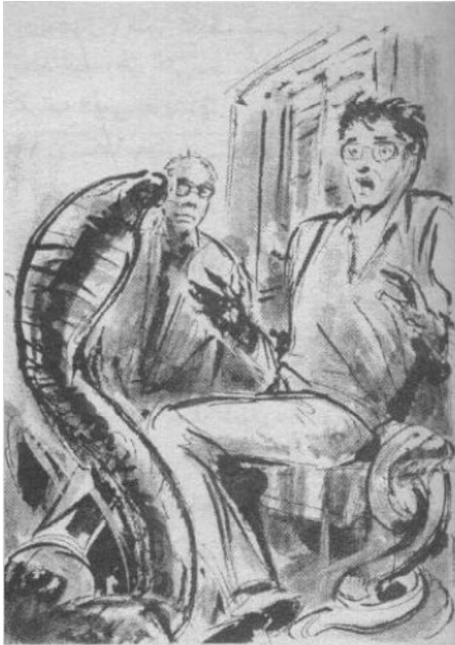
ورأيت ثعبان ( كوبرا ) يرفع رأسه في ذلك الوضع المنتصب الناشر الشهير ..

فقط السحر يستطيع تحويل هذا الواقع المتهالك إلى نجاح .. لن أنسى هنا طبعًا ذكر كتاب ضخيم عن الزواحف وجدته مفتوحًا كأنه كان يقرأ فيه ظهرًا ..