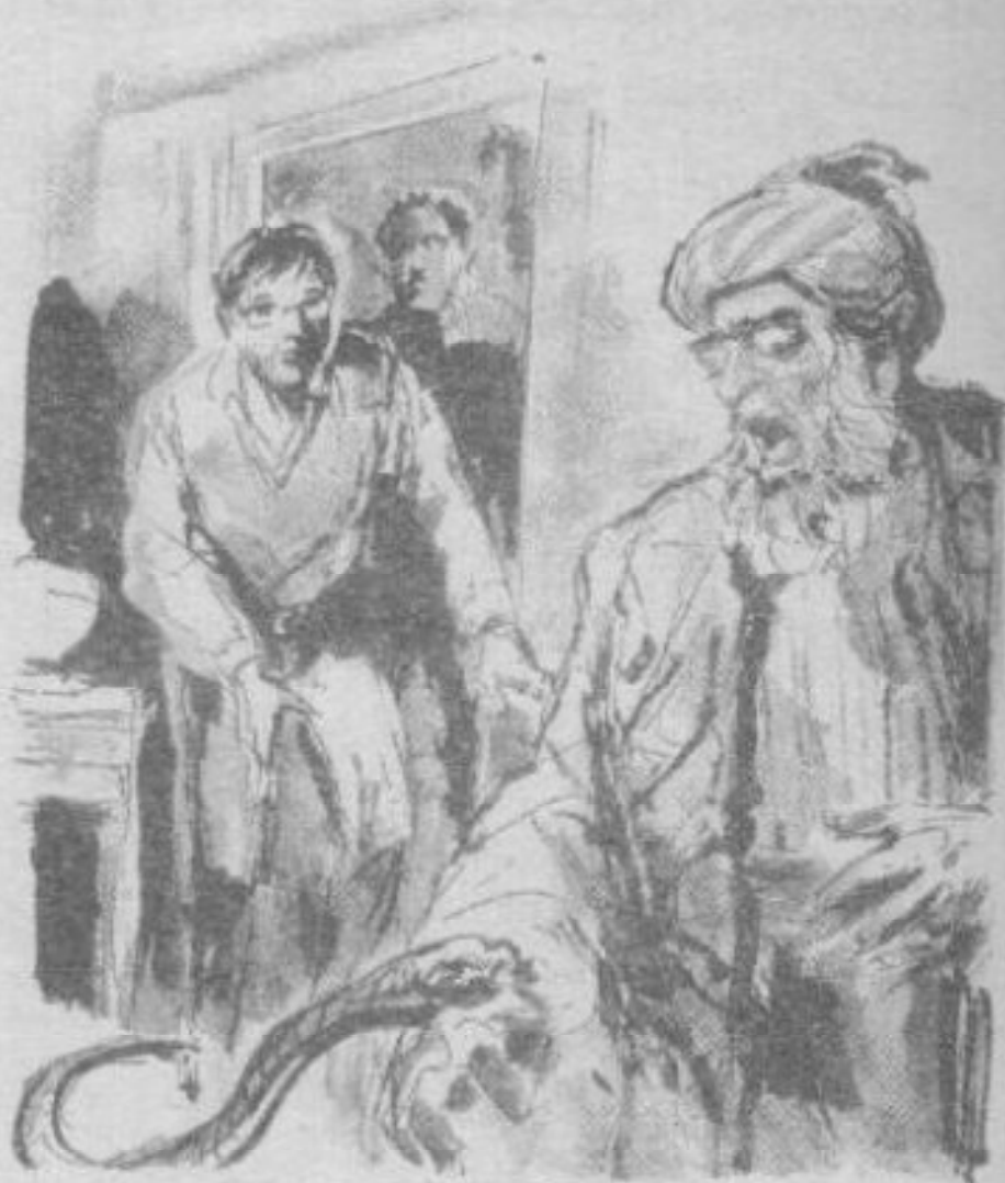
وهرعنا إلى المطبخ لنجد الرجل يولول ، بينما ثعبان صغير الحجم ينشب أسنانه في ذراعه العارية ..

وفى هذه اللحظة ، سقط ثعبانان صغيران من أعلى كم الرجل على الأرض .. النصاب !! إنها الحيلة العتيقة لهم : يدخلون الدار وهم يخفون