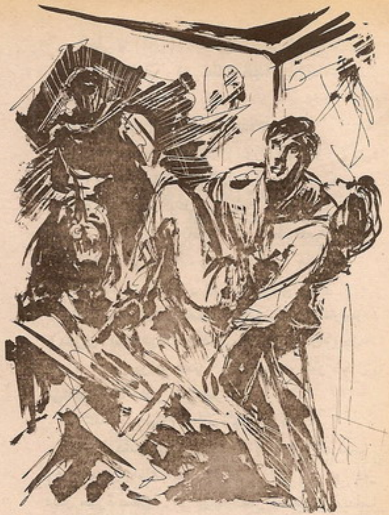
فانحنى بحمل زوجته ، على الرغم من جراحه العديدة ، وانطلق يعدو عبر المنزل ..