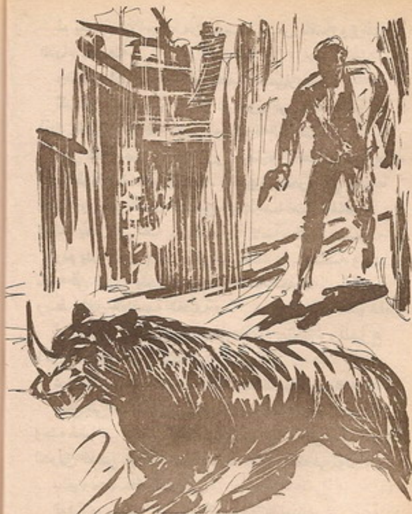
ثم انحرف ( الميناروس ) في طريق جانبي ، وأسرع ( نور )

أما تلك الكرة الهلامية ، فقد أطاحت بمسدس ( نور ) ، ثم دارت حول نفسها ، وانطلقت عائدة إلى يد ( ليدر ) ، الذي التقطها في بساطة ، ودسها في حزامه ، ووقف يتطلع إلى ( نور ) ، الذي قال في توتر :