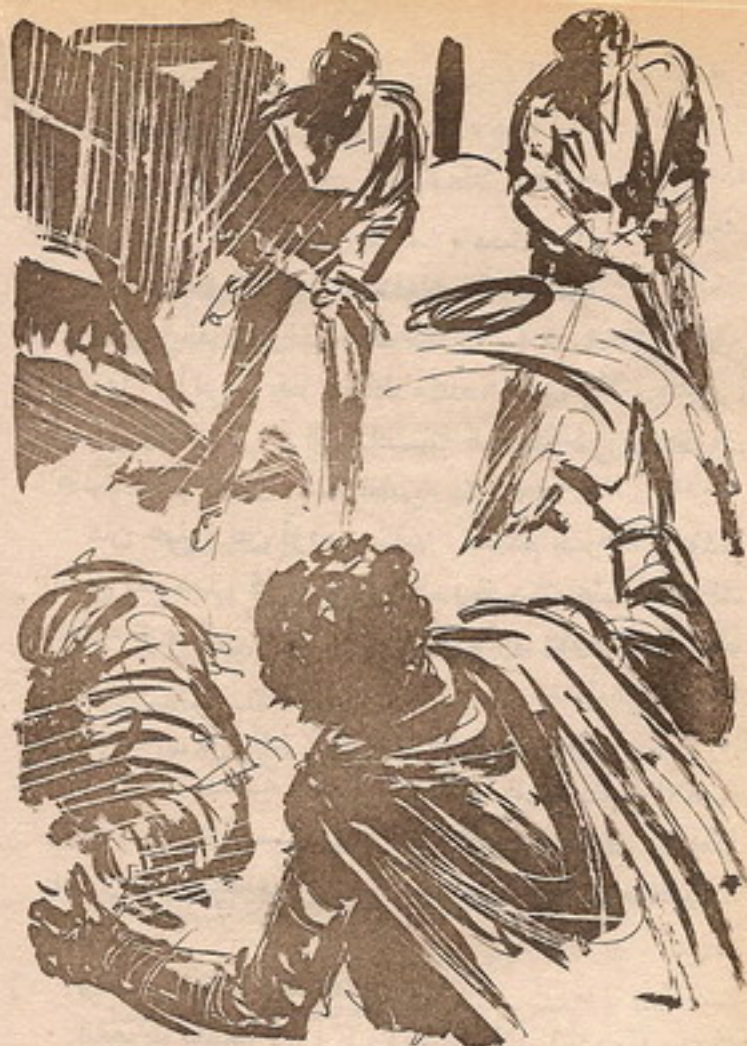
و ( نور ) يقفز ملقظاً مسدسه الليزري ، و ( أكرم ) يحاول وضع خزانة الرصاصات الجديدة في مسدسه ..