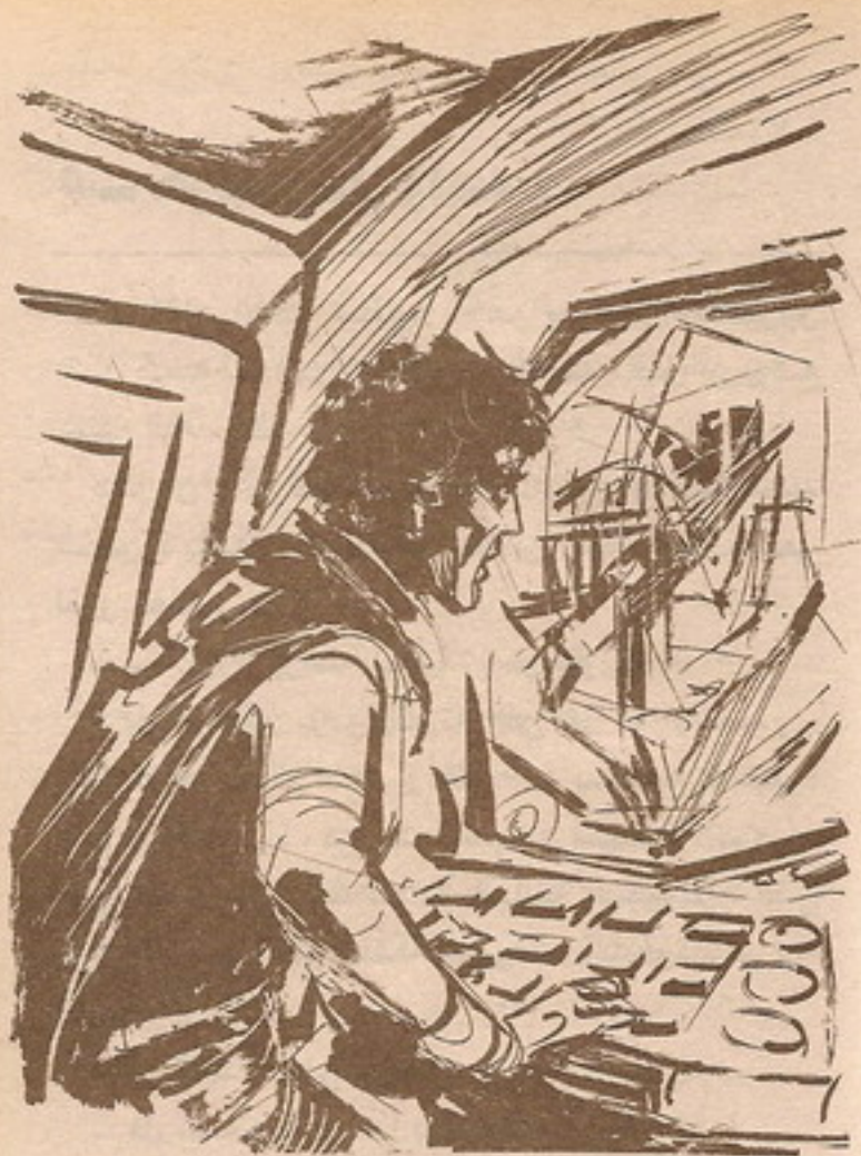
وفي بطء ، مال ( ليدر ) برأسه إلى الأمام ، ليعيد فحص