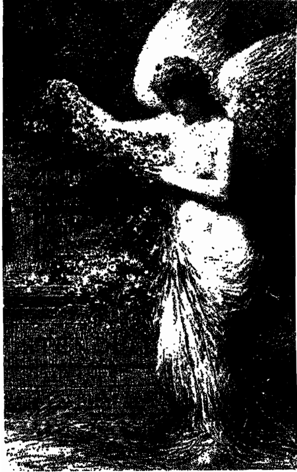
ليتوغرافيا من فانتين لاتور إلى ستندال