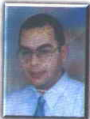
د. احمد خالد توفيق

هنا عاد (رامي) الصغير من تلك المواجهة المؤسفة لم يعد كما كان .. لقد صارت له نظرات شريرة غريبة .. صارت عيناه لا تنغلقان في أثناء النوم .. صار يرسم اشكالاً كئيبة مريعة لا يمكن أن يرسمها طفل .. صارت بصماته تثير ذهول أي خبير بصمات بفحصها .. أحياناً أحسبه لم يعد هو .. كأنه طفل آخر يشبهه .. أحياناً اعتقد أنه ليس طفلاً على الإطلاق .. فما رايتك في هذا كله يادكتور (رفعت) ...؟