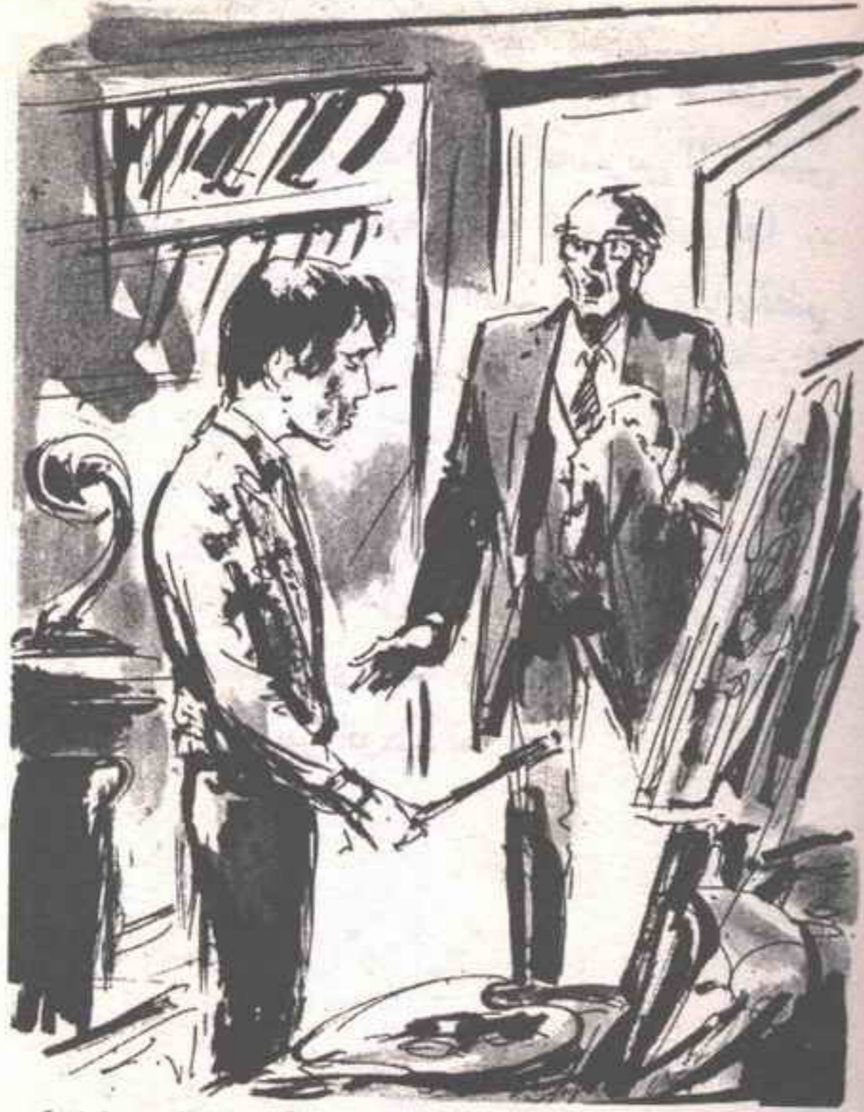
وهرعت إلى المكتب لأجد أسوأ كوابيسي قد تحقق .. الصبي كله قد دهن بالزيت الأزرق ..

بدأ الشريان إياه ينبض في صدغي منظرًا بإصابتي بالفالج من الغيظ ، وقلت :