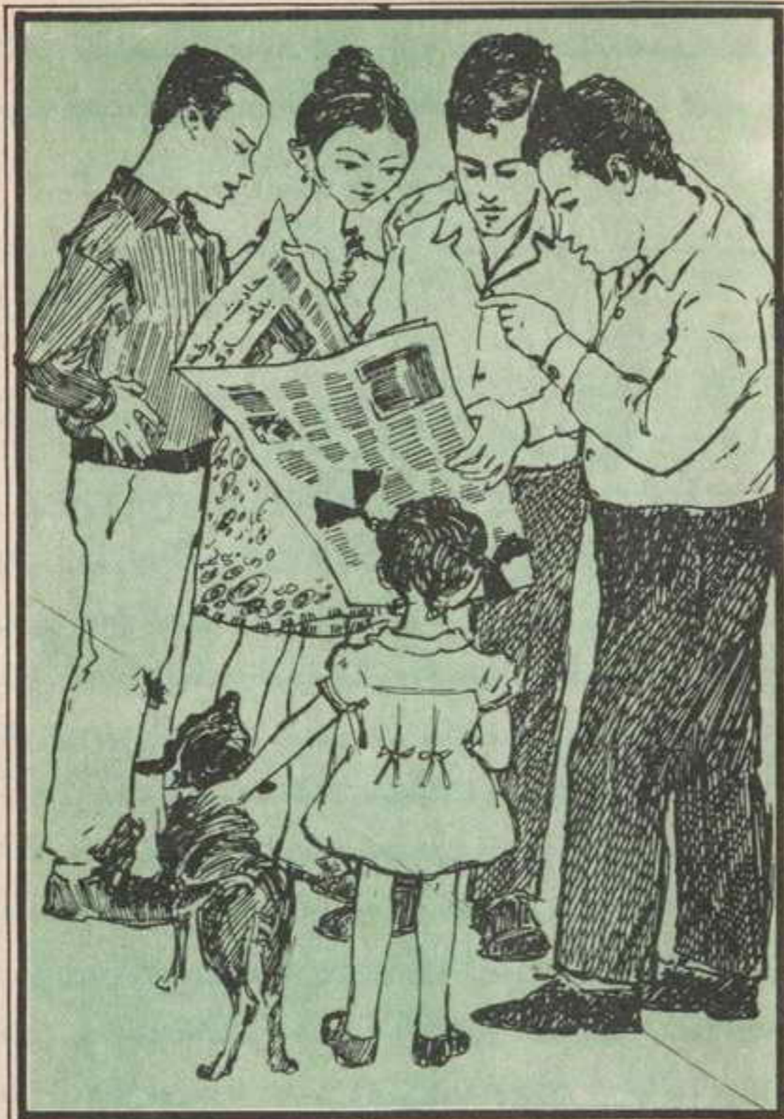
وأخذ الأصدقاء يقرءون تفاصيل الحادث في صحف الصباح