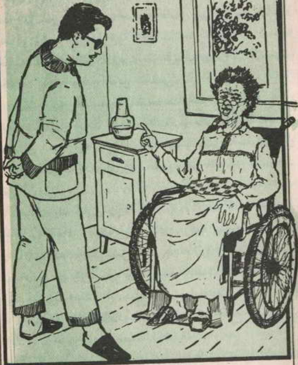
وروت العجوز المشلولة ما حدث في ذلك اليوم وما سمعته في غرفة مدام «روز»

تختخ : هل أستطيع أن أسألك بضعة أسئلة عن الحادث؟ . ردت الست «دولت» بجفاء : اسأل .. لقد قلت كل شيء لرجال الشرطة وأنا أذكر كل شيء كأنه حدث منذ دقيقة واحدة .. لقد سرقها «محسن» وماتت من الصدمة . لم يحتمل قلبها رؤية ثروتها تسرق منها فكف عن الدق .. مسكينة «مدام روز» .. مسكينة .. ليرحمها الله .