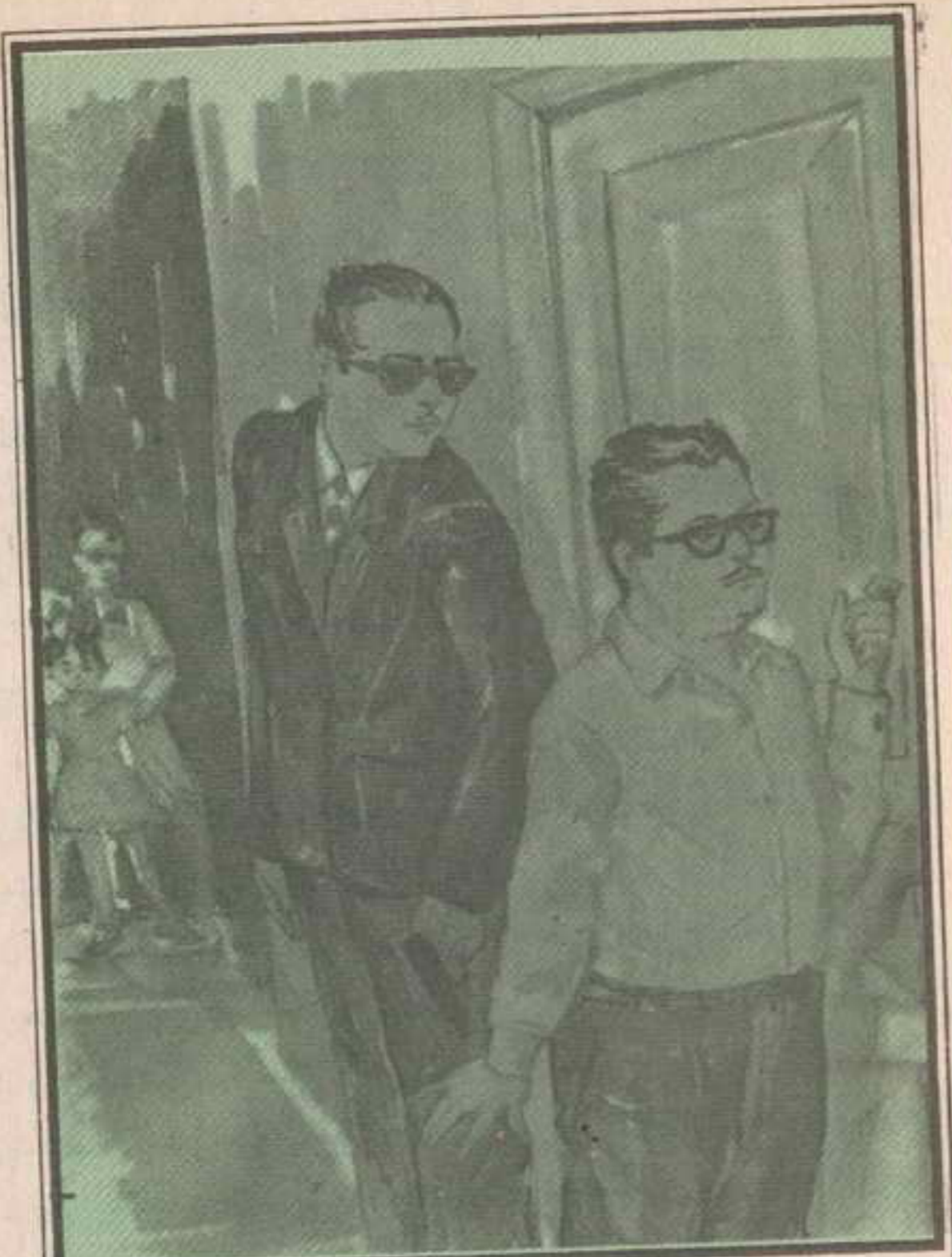
وطلب «تختخ» من المفتش أن ينتظر خارج الباب ويستمع إلى الحديث .

ارتبك «كامل» . واصفر وجهه وقال : أي أقوال؟ . تختخ : لقد قال إنه رآك نحو الساعة الواحدة قرب البنسيون يوم الحادث .