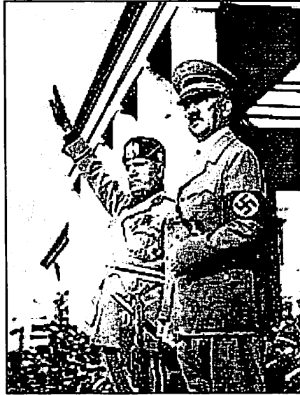
هتلر.. وروميل صفاء انتهى بالغدو